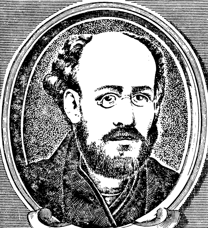
Лев Ильич Мечников 1828 - 1888