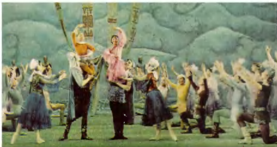
Сцена из балета «Козы Корпеш — Баян Сулу».

С 1954 года проводится большая работа по освоению целинных и залежных земель. Посевные площади респуб-