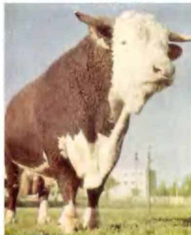
Бык казахской белоголовой породы