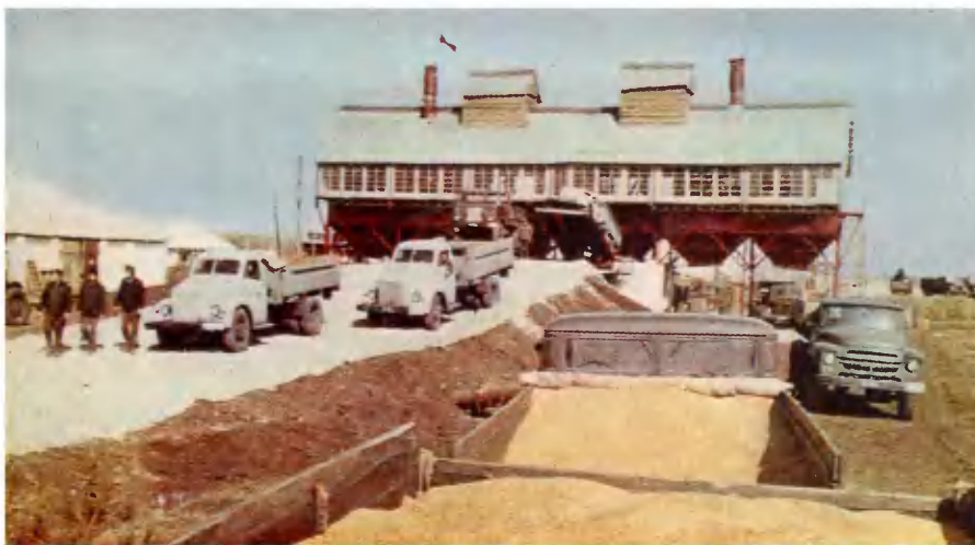
Кустанайская область. Механизированный зерноток совхоза «Тимирязевский».