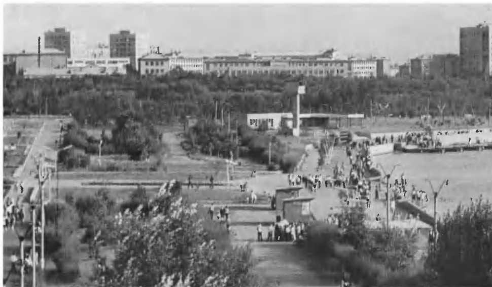
Караганда. Центральный парк культуры и отдыха.