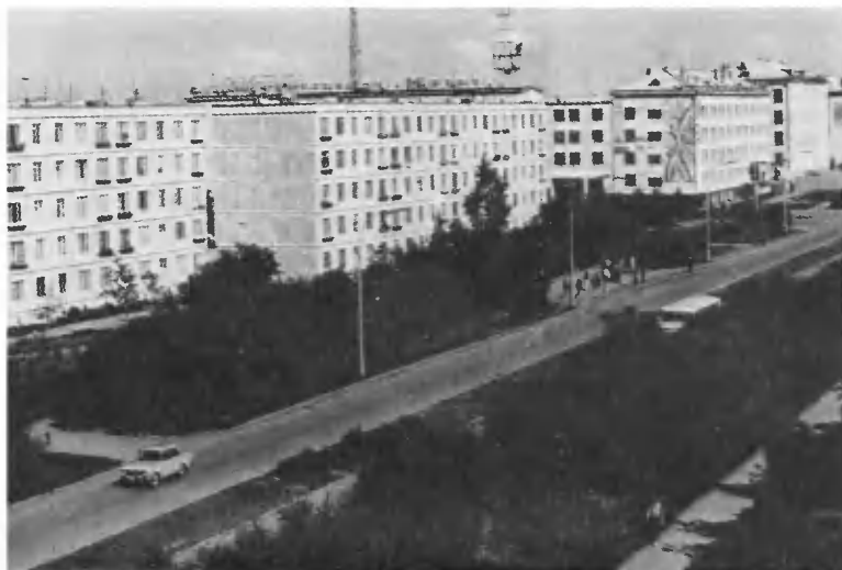
Джезказган — центр Джезказганской области.