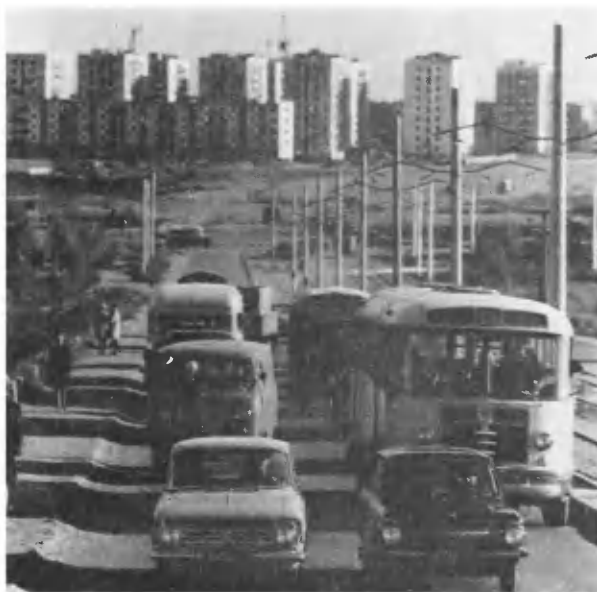
Павлодар. Новый микрорайон.

депутата по национальности казахи, много русских, украинцев, белорусов, уйгуров, немцев, корейцев. В числе депутатов 170 женщин, из них 56 казашек.