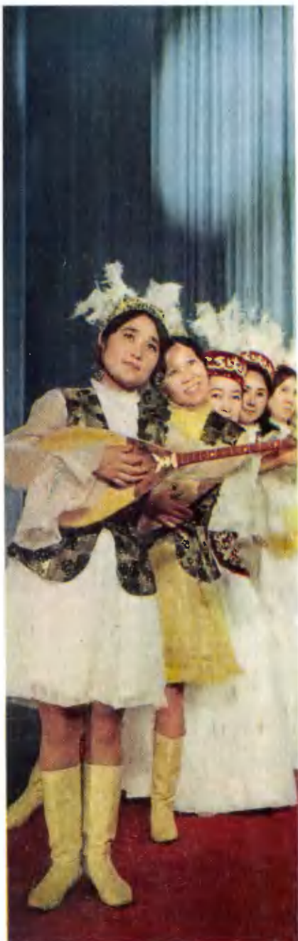
Самодельный домбровый оркестр Казахского женского педагогического института.

лики достигли 34 миллионов гектаров. На целинных землях организовано свыше 700 новых совхозов. Более 600 тысяч патриотов из РСФСР, с Украины и других республик участвовали в освоении целины.