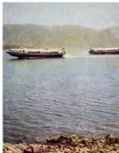
На Бухтарминском водохранилище.