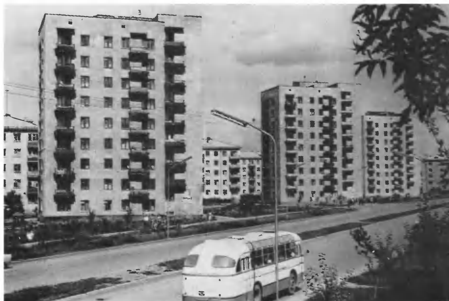
Целиноград. Проспект Победы.