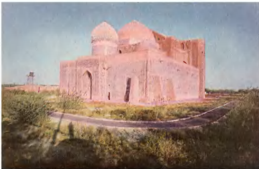
Мемориальный комплекс Ахмеда Яссави.