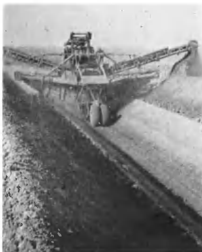
Наступление на пустыню.