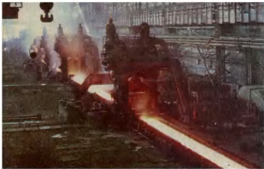
Карагандинский металлургический комбинат. Прокатный стан «1700».