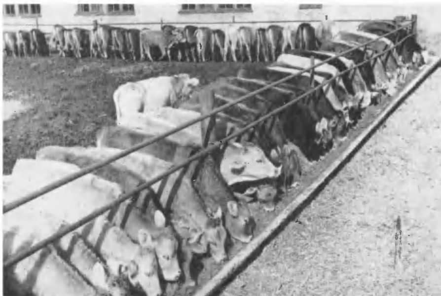
Целиноградская область. На ферме совхоза «Еркиншиликский».