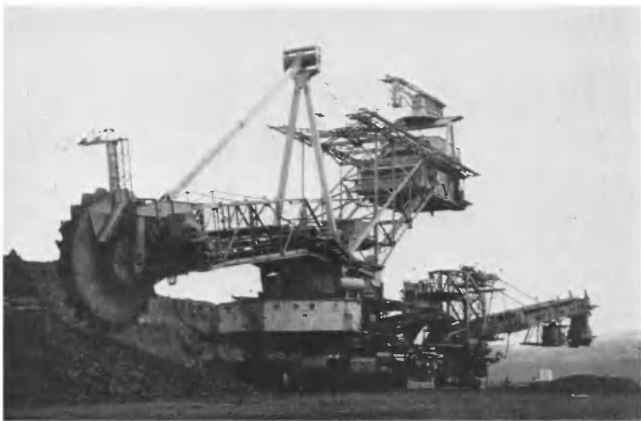
Экибастуз. Роторный экскаватор в угольном разрезе «Богатырь».