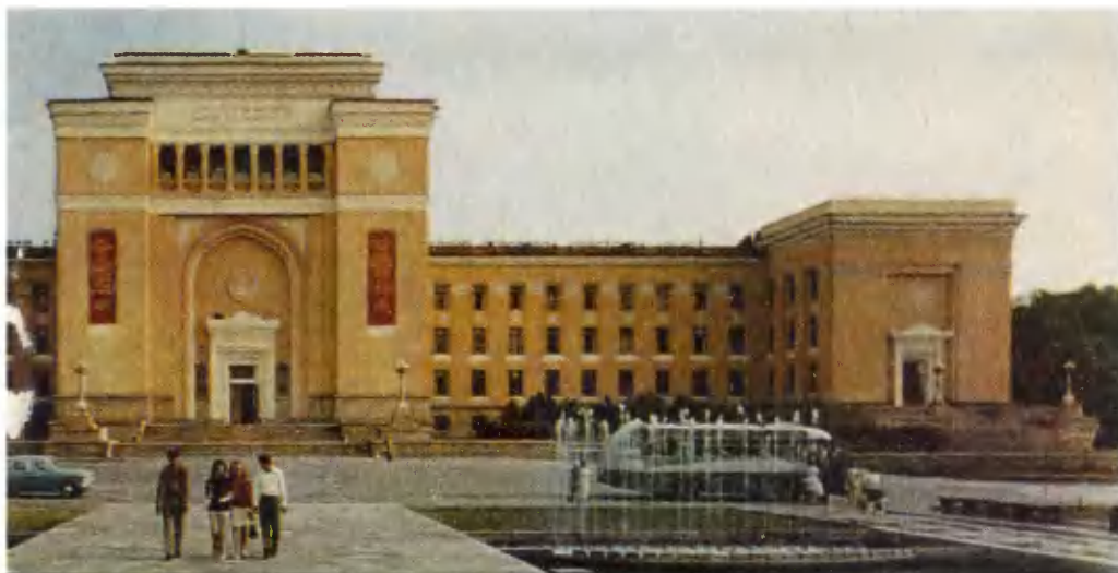
Здание Академии наук Казахской ССР.