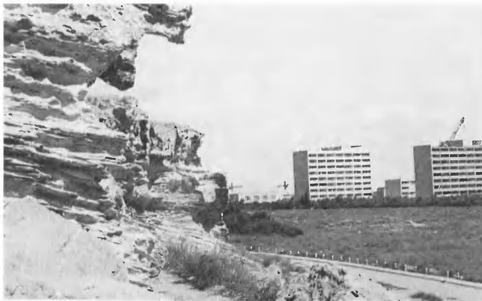
Шевченко — центр Мангышлакской области.