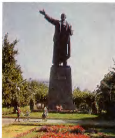
Алма-Ата. Памятник В. И. Ленину.

В Казахской ССР 19 областей: Алма-Атинская, Актюбинская, Восточно-Казахстанская, Гурьевская, Джамбулская, Джезказганская, Карагандинская, Кокчетавская, Кызыл-Ординская, Кустанайская, Мангышлакская, Павлодарская, Северо-Казахстанская, Семипалатинская, Талды-Курганская, Тургайская,