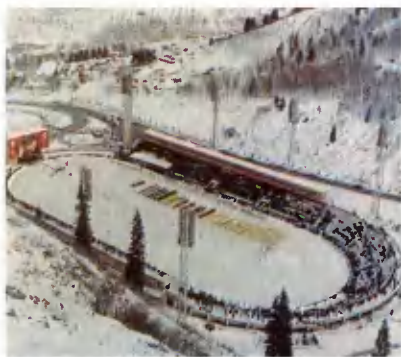
Высокогорный спортивный комплекс «Медео».