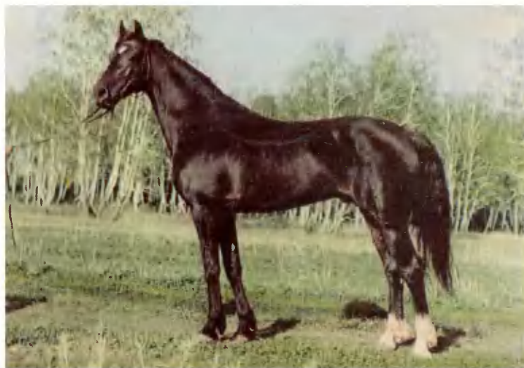
Жеребец кустанайской породы.