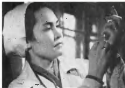
Дорога в Медео.