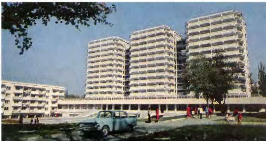
Алма-Ата. Жилые дома на проспекте В. И. Ленина.