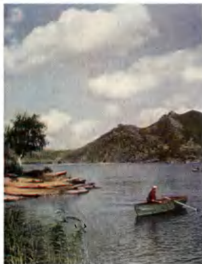
Баянаул. Озеро Жасыбай.

Социалистическое соревнование за успешное выполнение планов четвертого года пятилетки широко развернули труженики сельского хозяйства рес-