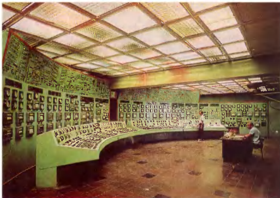
Джамбулская ГРЭС. Центральный пульт управления.