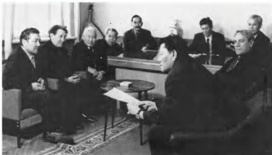
Группа писателей Казахстана.

В читальном зале Государственной библиотеки Казахской ССР им. А. С. Пушкина.