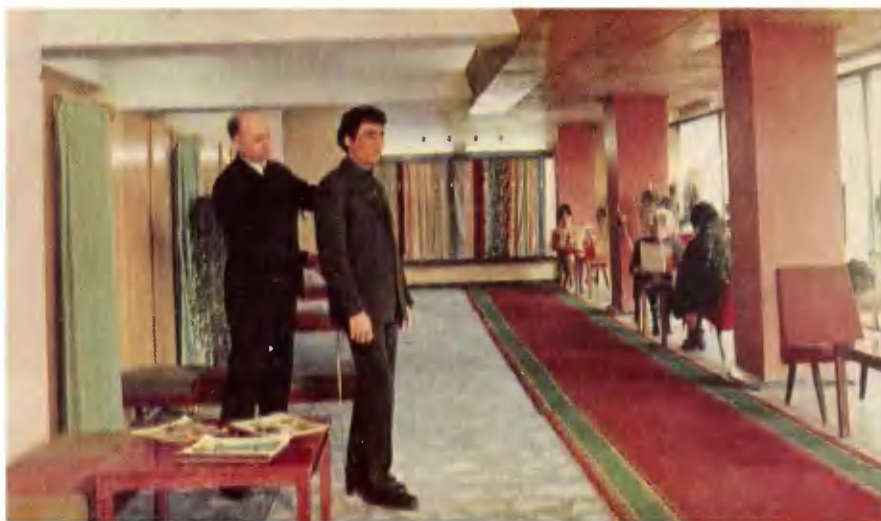
Ателье «Люкс» пошива одежды по индивидуальным заказам населения.