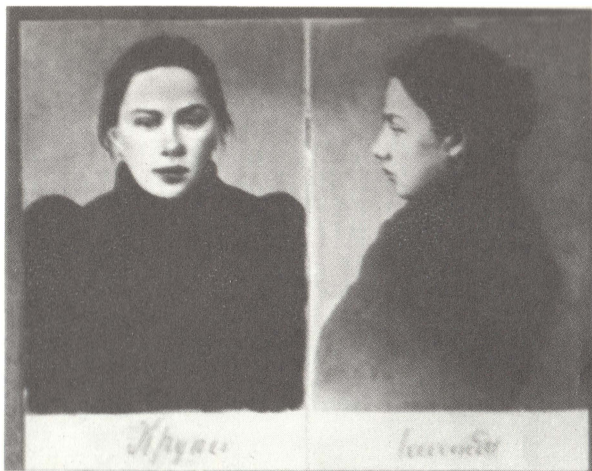
Н. К. Крупская. 1896 г.