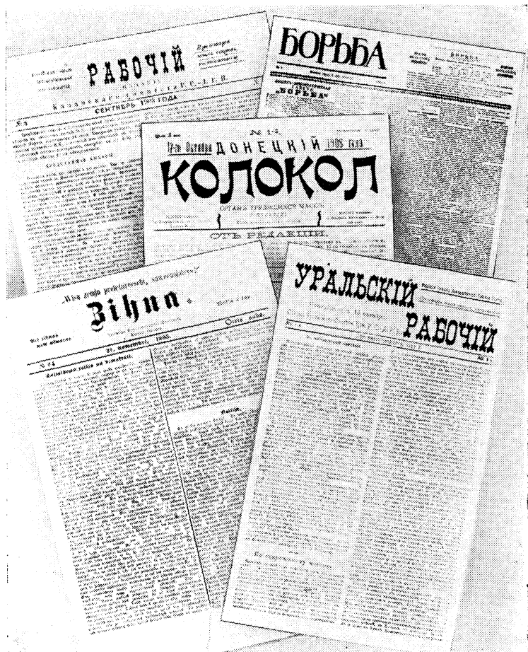
Местные большевистские газеты (1905—1908 гг.).

с ноября 1905 по 1917 ежедневно. Газета держалась прогерманской ориентации. «У нас много острили, — писал Ленин, — по поводу того, что «Русское знамя» вело себя очень часто, как «Прусское знамя» (Соч., т. 22, стр. 172). С 1906 издателем «Р. З.» являлся глава черносотенцев А. И. Дубровин, пользовавшийся всемерной поддержкой