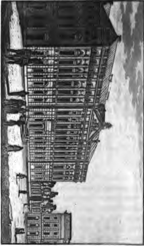
Enam's naphawakoti Navgadu ds. Daphwabr.