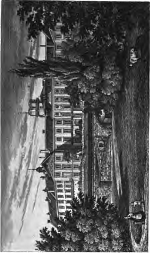
Tamara to Bapuabo