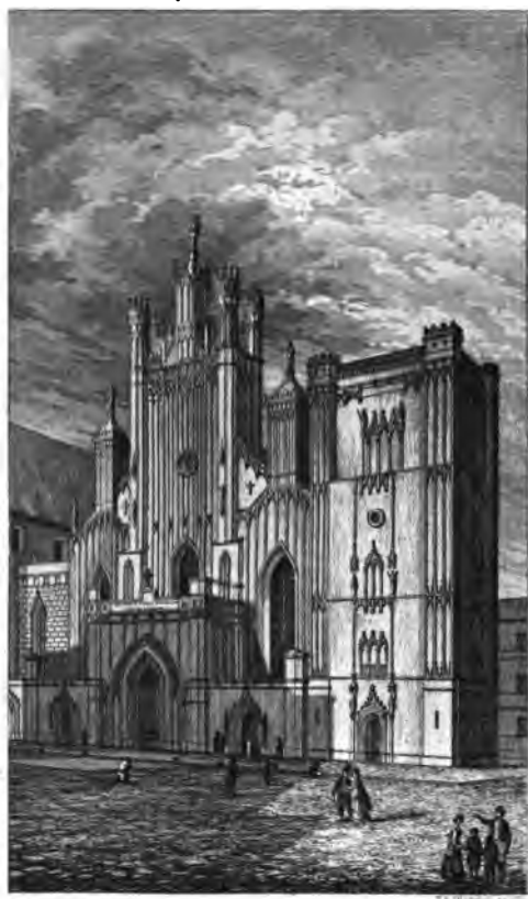
27 Коллежъ каменнѣеку Об. Иоаннъ бж. Воспеленъ