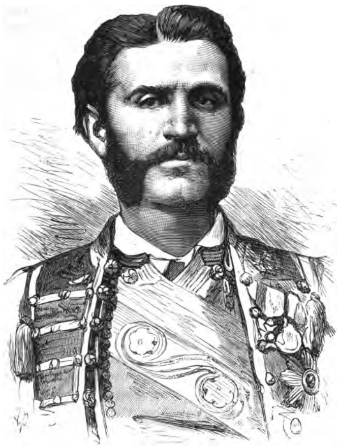
Николай I, князь Черногоріи.