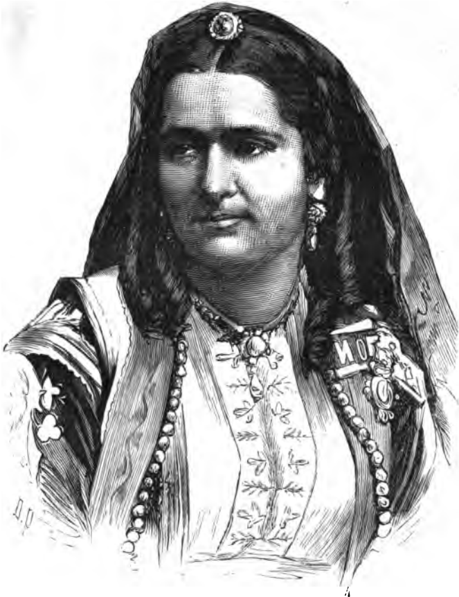
Милена, княгиня Черногорская.