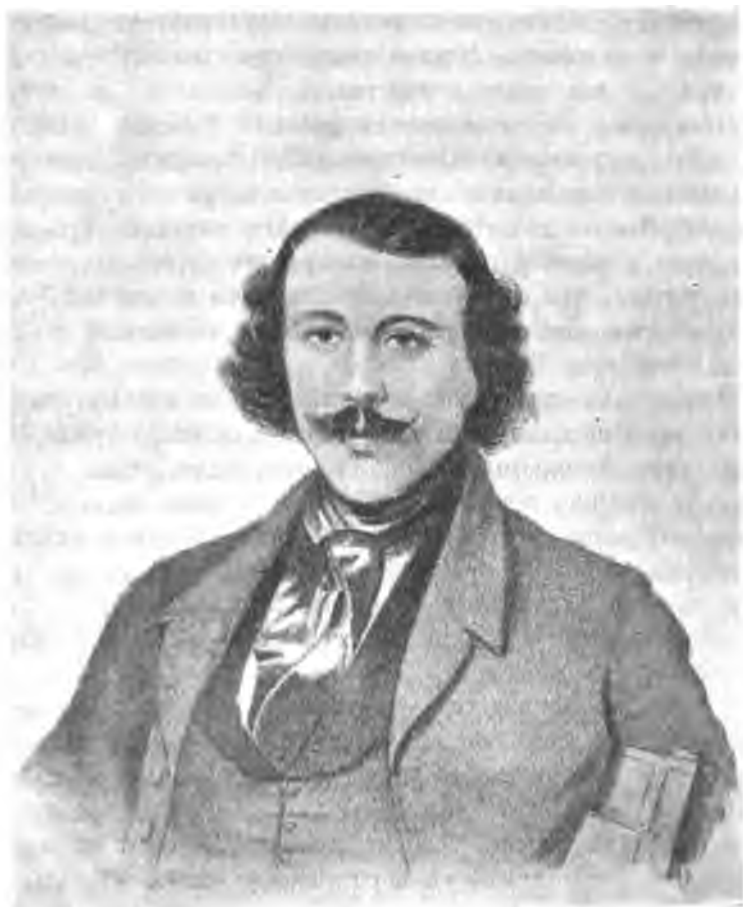
Михаилъ Александровичъ Бакунинъ.

какъ бы проклятіе, брошенное въ лицо всѣмъ притѣснителямъ Польши; я прихожу въ него, господа, одушевленный глубокою любовью и непоколебимымъ уваженіемъ къ моему отечеству.