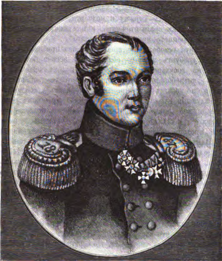
Павелъ Ивановичъ Пестель.

Главныя задачи вѣка и своего времени онъ усматривалъ „въ борьбѣ между массама народными и аристократіей всякаго рода, какъ на богатствѣ, такъ и на просожденіи основанными“, онъ