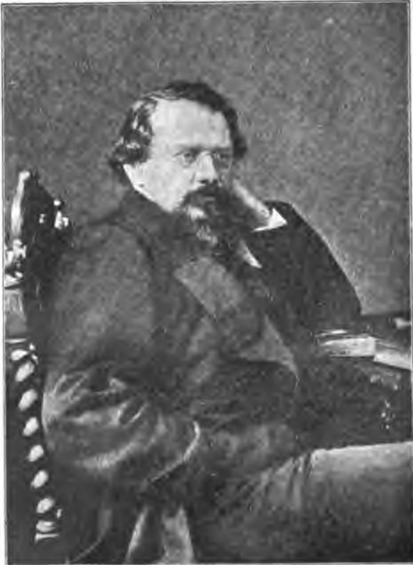
Константинъ Дмитріевичъ Кавелинъ.

никакой пользы, а можетъ произойти большой вредъ для дѣла. Я знаю, какъ это будетъ перетолковано, и иду на все. Пусть думаютъ, что хотятъ. Недалеко то время, когда каждому дастся возможность заявить свое убѣжденіе не количествомъ налитыхъ и разбитыхъ рюмокъ, не звонкими фразами, а дѣломъ“.