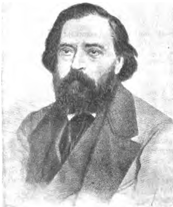
Николай Платоновичъ Огаревъ.

„Что касается до насъ—нашъ путь впередъ назначенъ, мы идемъ съ тѣмъ, кто освобождаетъ и пока онъ освобождаетъ; въ этомъ мы послѣдовательны всей нашей жизни. Какъ бы слабъ