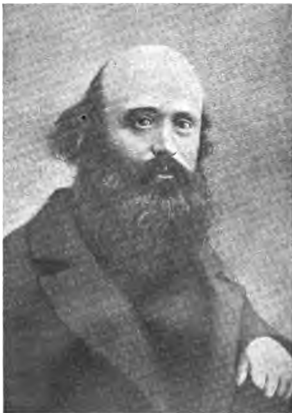
Михаилъ Васильевичъ Буташевичъ-Петрашевскій.

извѣстное письмо Бѣлинскаго къ Гоголю), гдѣ лились горячія рѣчи, сыпались критическія замѣчанія по адресу правительства, гдѣ осуждалась современная Россія, и гдѣ рѣяли мечты о желательномъ государственномъ и социальномъ будущемъ. Государственное будущее рисовалось однимъ въ конституціонной постановкѣ вопроса, а социальное на основахъ, почерпнутыхъ