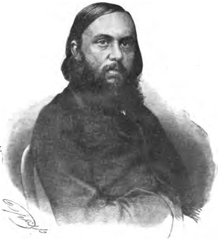
Василій Степановичъ Курочкинъ.

ному разврату, нравственному растлѣнію... Пусть наемные риторы твердятъ что угодно въ своихъ журналахъ, — никто не приметъ ихъ слова за выраженіе общественнаго мнѣнія; свободные и честные органы будутъ хранить молчаніе, потому что они не захотятъ чувствовать и мыслить по командѣ, даже и въ томъ случаѣ, когда бы мыслили и чувствовали заодно съ правительствомъ. Но отнять у общественнаго мнѣнія свободу выраженія