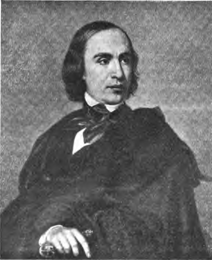
Тимофей Николаевичъ Грановскій.

бурныхъ, грозныхъ, которые въ „гнѣвѣ“ своемъ чувствуютъ исполнѣ свою жизнь“, какъ Лютеръ, а тѣхъ ясныхъ, кроткихъ, которые такъ же просто надѣвали вѣнокъ славы на свою голову, какъ и терновый вѣнокъ.