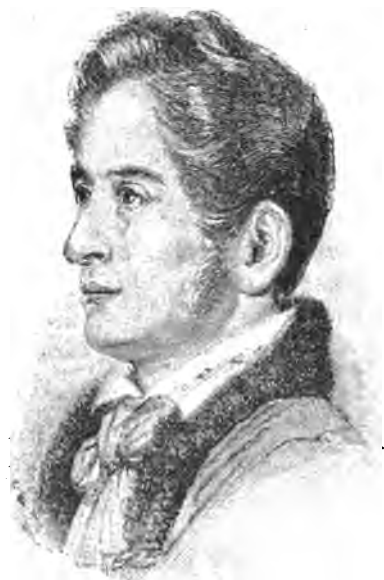
Александръ Ивановичъ Герценъ (въ молодости).