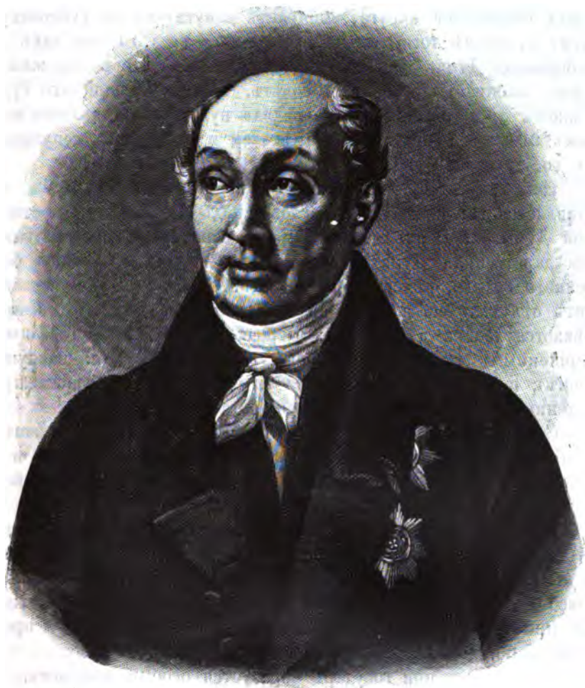
Миханъ Михайловичъ Сперанскій.

Думы. Казенныя селенія отъ каждаго пятисотнаго участка высылають въ Думу одного старшину. Въ волостной Думѣ всѣ голоса равны, и никто не можетъ имѣть больше одного голоса. Волостная Дума избираетъ волостное правленіе, которое въ те-