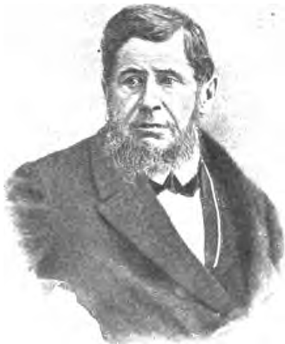
Николай Ивановичъ Тургеневъ.

исторіей Россіи (начиная съ 1812 г.), съ ея политическимъ и соціально-экономическимъ строемъ, съ идеалами прогрессивной части общества вообще и декабристовъ въ частности и намѣтили также „будущность Россіи“ ( Pia desideria ) въ интересахъ ея прогрессивнаго развитія, согласно опыту западно-европейской