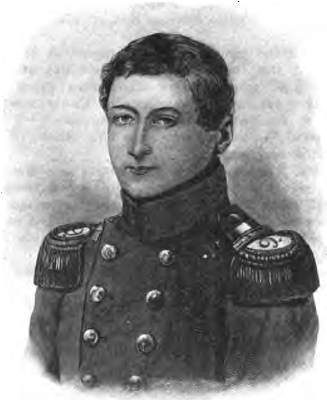
С. И. Муравьевъ-Апостолъ.

Отвѣтъ. Нѣтъ! Они провляты суть отъ Него, яко притѣснители народа, а Богъ есть человеколюбець. Да прочтеть каждый желающій знать судъ Божій о царяхъ, книги Царствъ главу 8-ю: собращася мужи израилевы и придоша къ Самуилу и рекоша ему: нынѣ постави надъ нами царя, да судитъ ны; и бысть лукавъ глаголь сей предъ очима Самуиловима, и помолися Самуилъ во Господу, и рече Господь Самуилу: послушай нынѣ