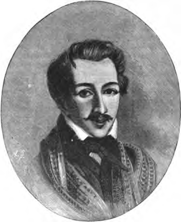
Петръ Григорьевичъ Каховской.

Каховского изъ числа членовъ. А потомъ они опять сходились и разсуждали все о томъ же. До Каховского доходили льстившіе его, быть можетъ, слухи о томъ, что Рылѣвъ указываетъ на него, какъ на Занда, но онъ горѣлъ отъ негодованія, когда чувствовалъ, что на него смотрять, какъ на орудіе Рылѣва. Его нѣсколько обижало отношеніе къ нему Рылѣва. Послѣдній не