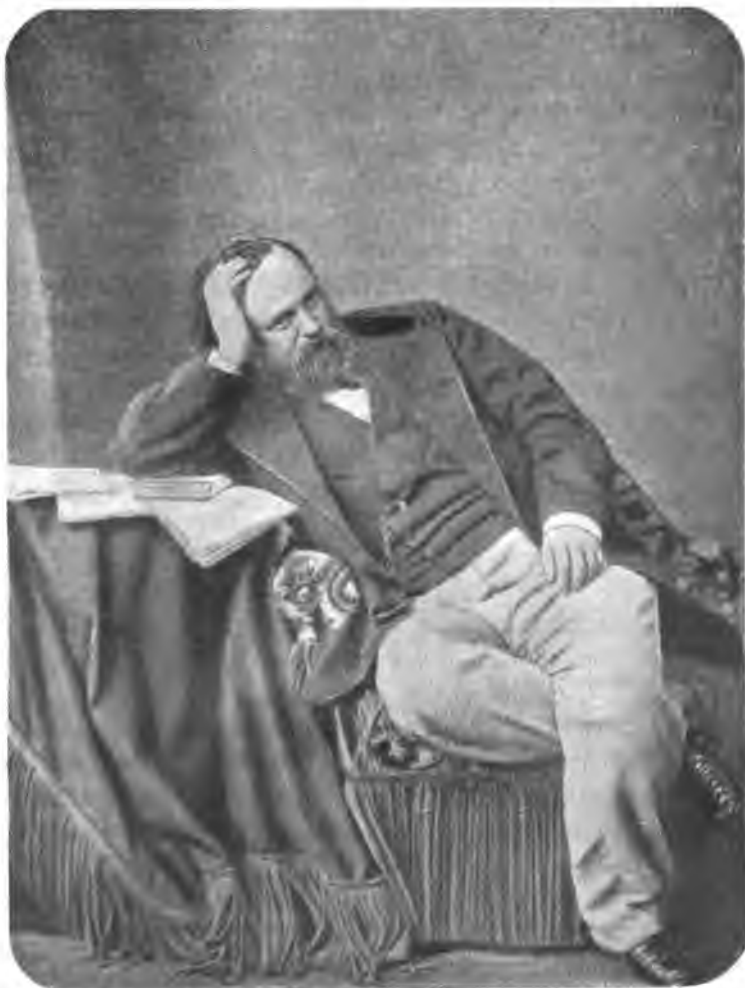
Александръ Ивановичъ Герцень.

безъ послѣдствій, и что дворяне продолжаютъ отговариваться тѣмъ, что не знаютъ, на какихъ началахъ правительство желаетъ устроить дѣло, а сами придумать не могутъ. Тогда императоръ призналъ своевременнымъ передать возбужденный имъ