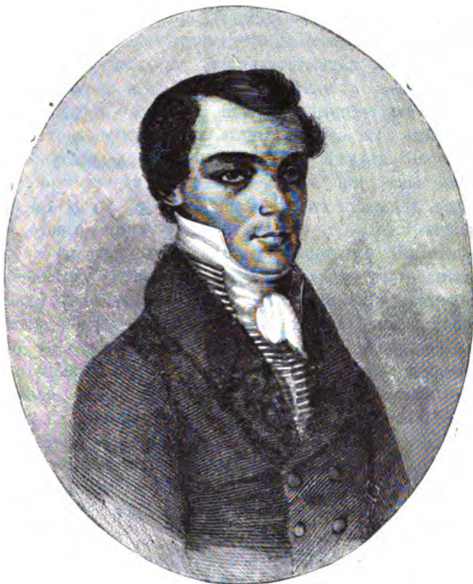
Кондратій Федоровичъ Рылѣевъ.

брать на себя, и по успѣхѣ въ предпріятіи; стараться избрать людей, извѣстныхъ въ государствѣ, которые бы составляли временное правленіе, пока изберутся депутаты, и имъ представить конституцію, которую они въ правѣ принять или что въ ней перемѣнить, или совершенно отвергнуть. Рылѣевъ съ этого смѣялся, говоря: