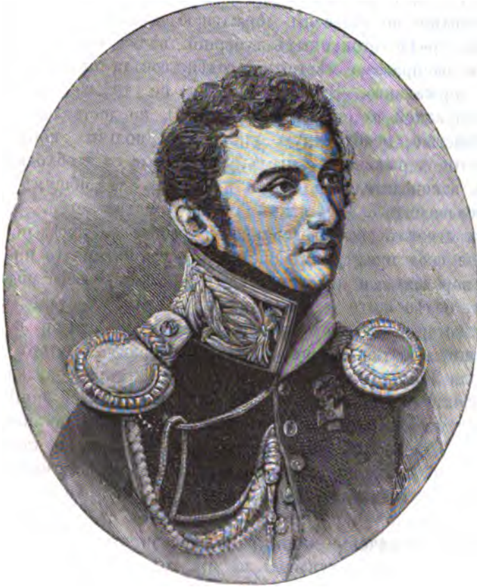
Никита Михайловичъ Муравьевъ.

имѣющіе право быть избранными въ тысяцкіе. Граждане первой категоріи могутъ быть, кромѣ того, и присяжными, а граждане по второму списку, помимо владѣнія перечисленными правами, могутъ быть еще избираемы въ члены верховной думы, въ правители державъ, въ члены державныхъ думъ и въ члены державныхъ судовъ.