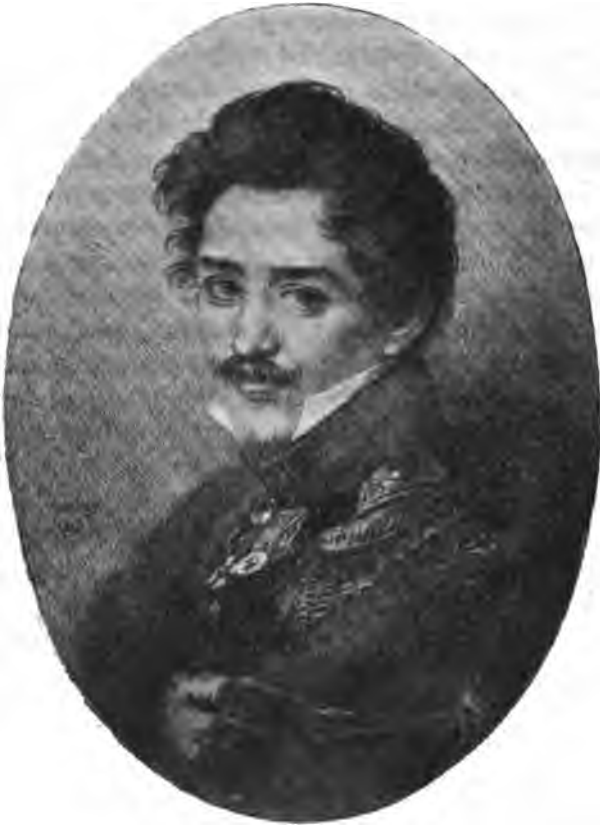
Кн. С. Г. Волконскій.

Извѣстіе о кончинѣ Александра Павловича прибыло въ Петербургъ 27 ноября, и сразу же вся путаница съ духовнымъ завѣщаніемъ почившаго императора дала свои плоды. Это же