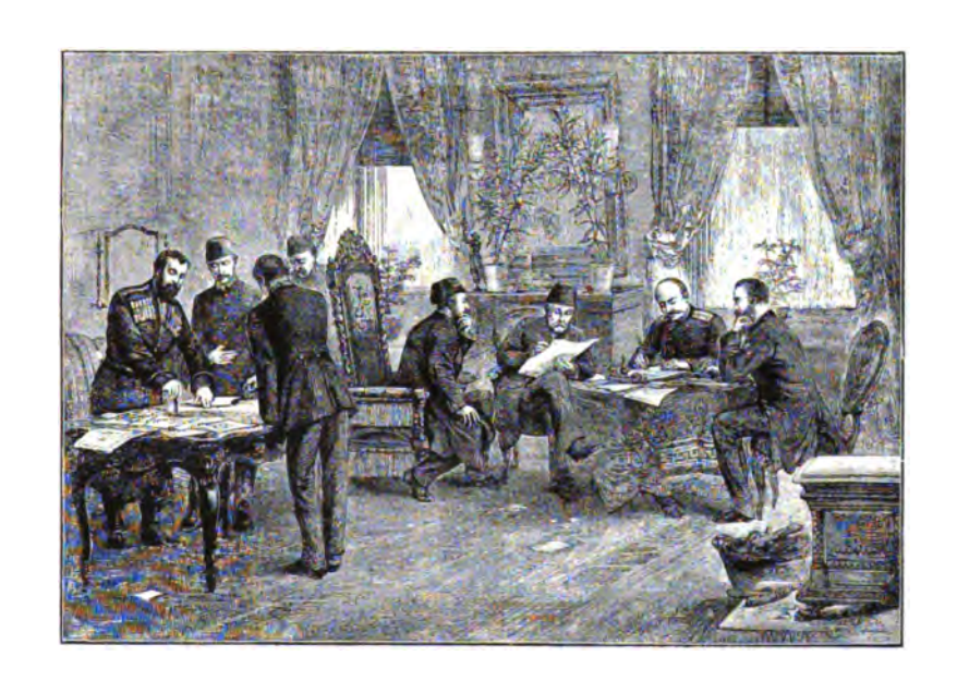
Подписаніе предварительнаго мира въ Санъ-Стефано.