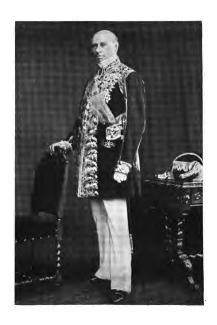
Баронъ (графъ съ 1871 г.) Филиппъ Ивановичъ Брунновъ.