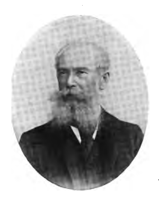
Александръ Ивановичъ Нелидовъ.