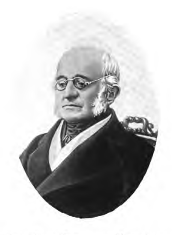
Графъ Карлъ Васильевичъ Нессельроде.