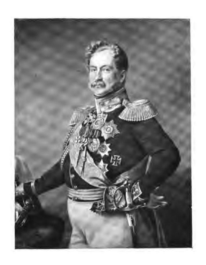
Графъ (князь съ 1856 г.) Алексъй Оедоровичъ Орловъ.