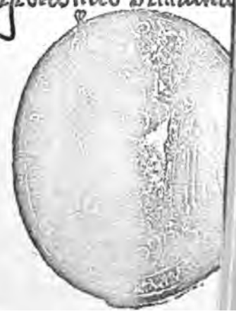
Факсимиле грамоты Св. Теодосія Прокофію С.