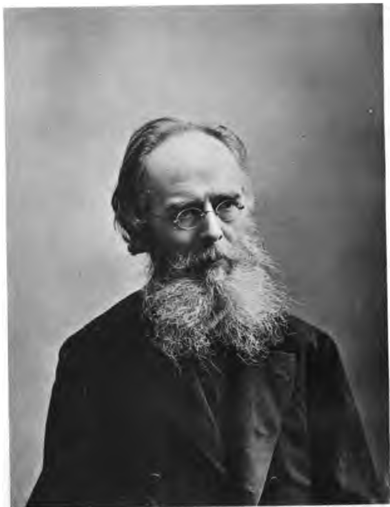
Съёмочная С. В. Кузьменко.