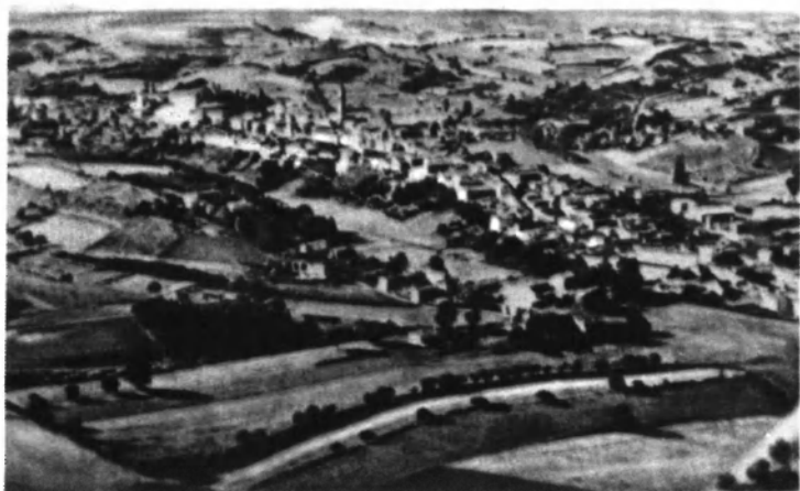
Вид Фубине Монферрато.