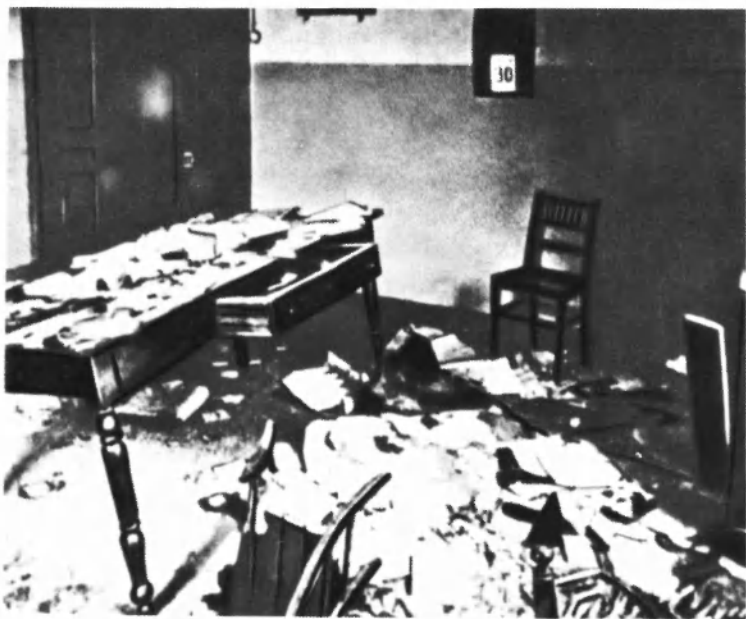
Помещение Компартии Италии в Турине, разгромленное фашистами в декабре 1922 года.

Фотографии Луиджи Лонго, опубликованные фашистской полицией для розыска его как «активного и опасного коммуниста».