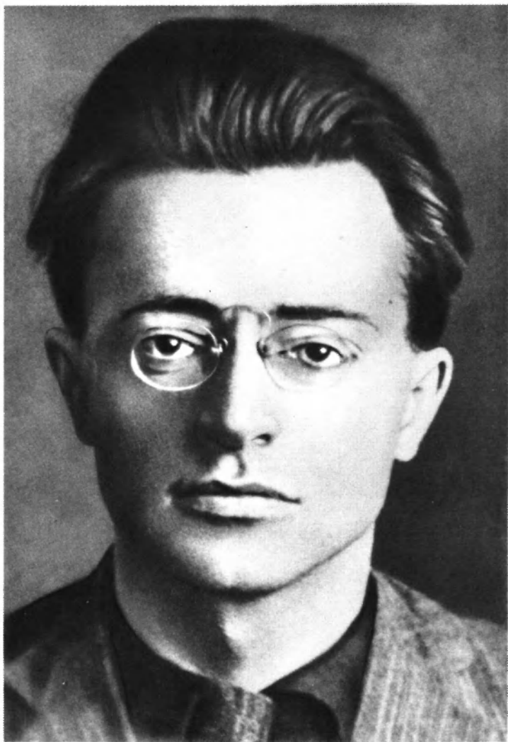
Пальмиро Тольятти. Вторая половина 20-х годов.