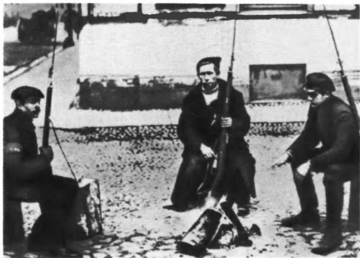
Патруль Красной гвардии в Петрограде в октябрьские дни 1917 года.