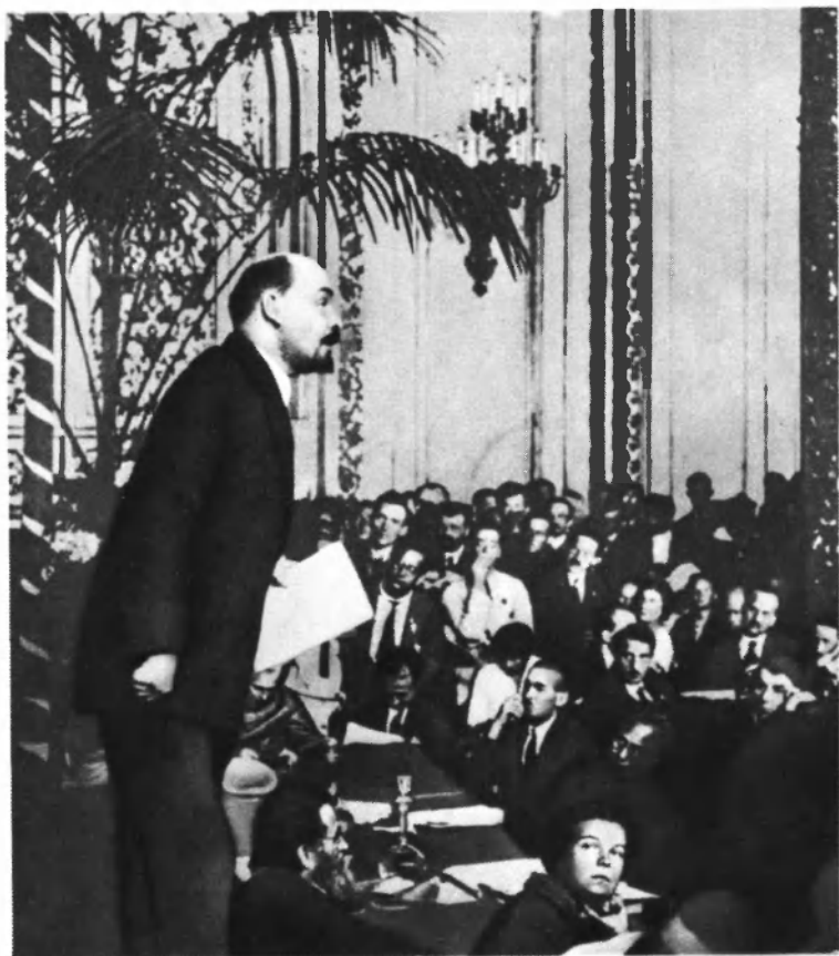
Выступление В. И. Ленина на III конгрессе Коминтерна.