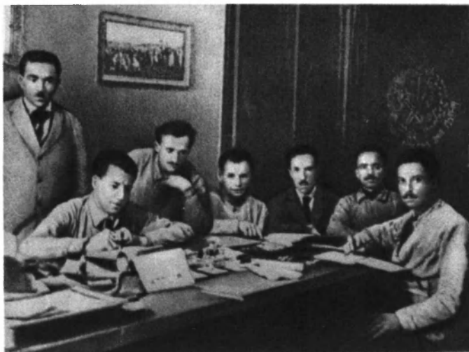
Заседание фабрично-заводского совета завода «Фиат-Центро». Турин. Сентябрь 1920 года.

Газета Федерации социалистической молодежи «Авангард». В этом номере сообщалось о присоединении ФСМ к Компартии Италии.