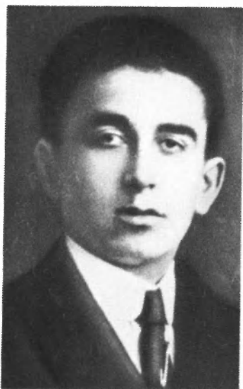
Луиджи Лонго в 1919 году после демобилизации из армии.