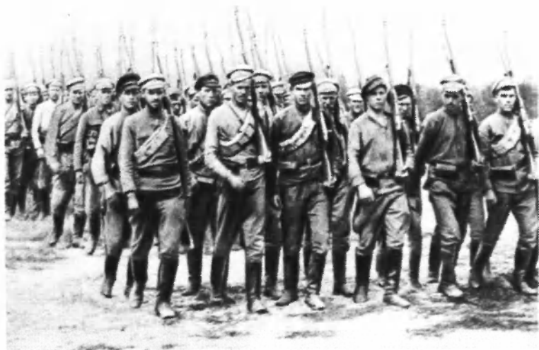
Один из первых полков регулярной Красной Армии перед отправкой на фронт. 1918 год.