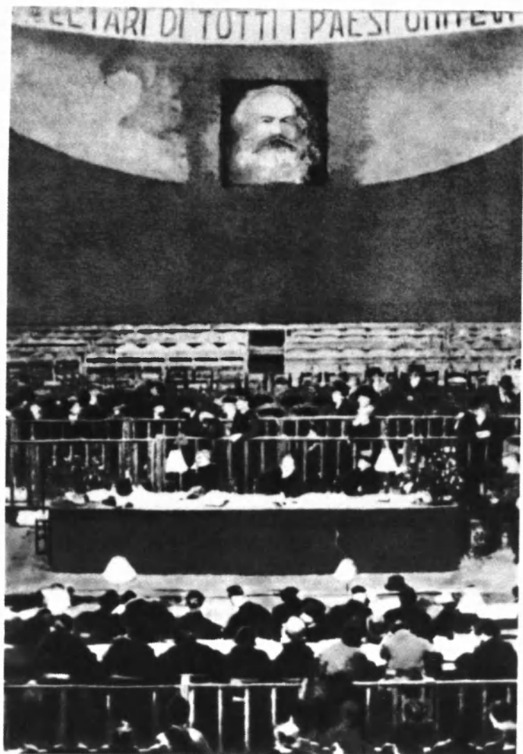
Заседание XVII съезда Итальянской социалистической партии в театре Гольдони в Ливорно. Январь 1921 года.