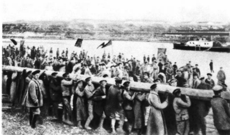
Москва. Субботник на Воробьевых горах. 1921 год.