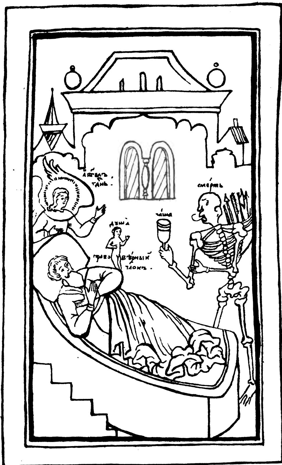
Талматники древней письменности