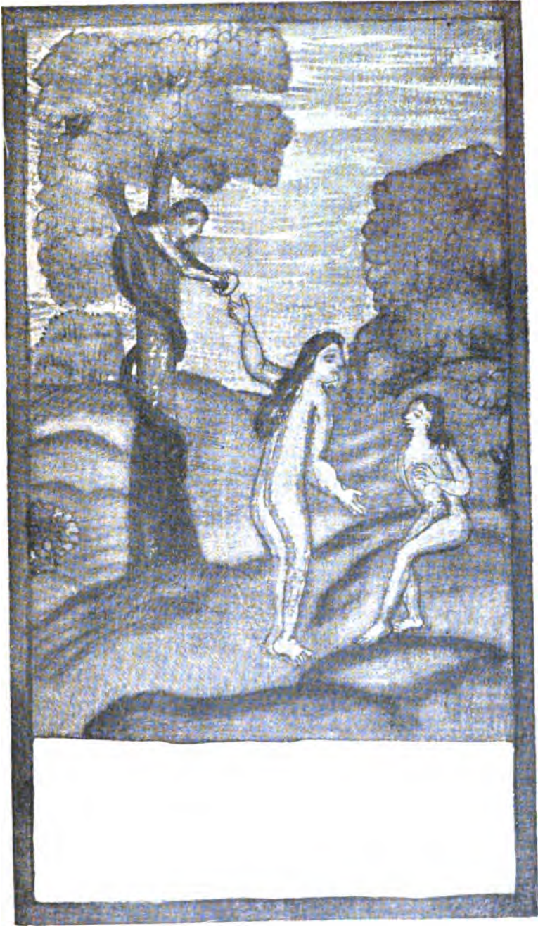
2. Грѣхопадєніє прародителєй.