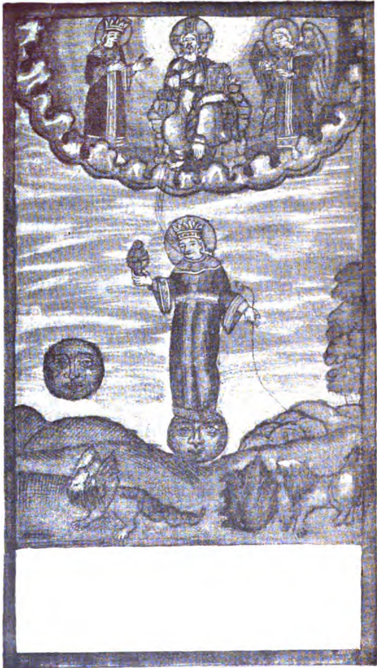
4. Душа чистая.