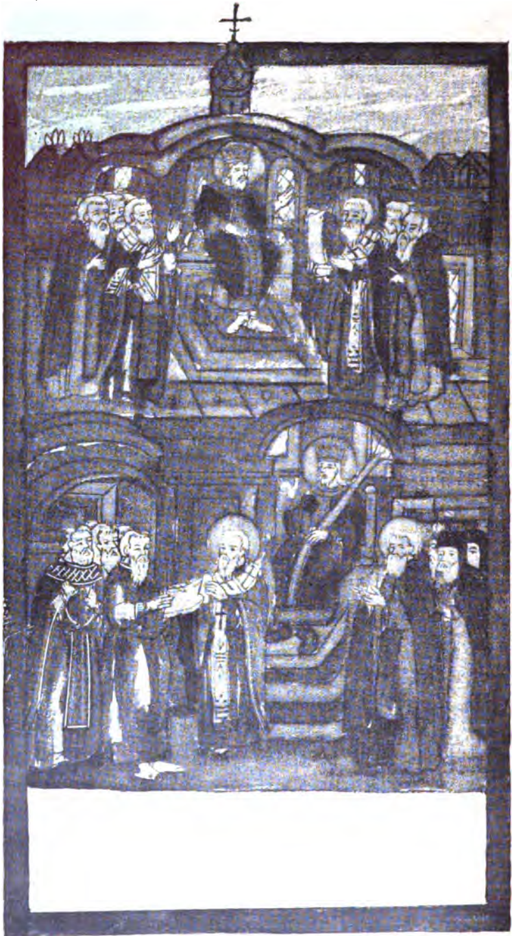
5. Первый вселенский соборъ.