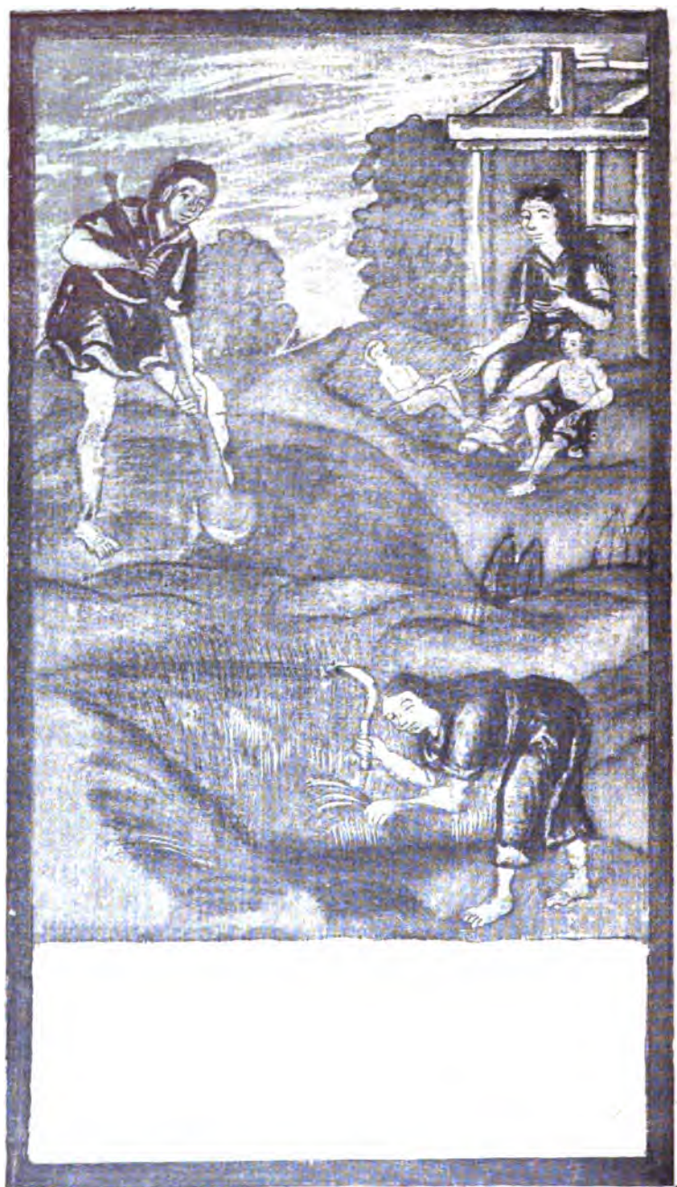
3. Труды Адама и Евы.