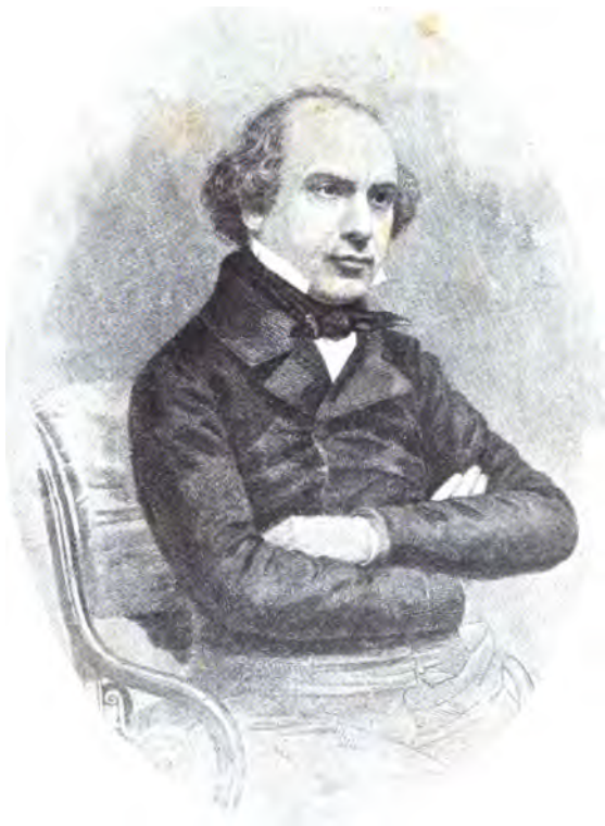
Т. Н. ГРАНОВСКІЙ.