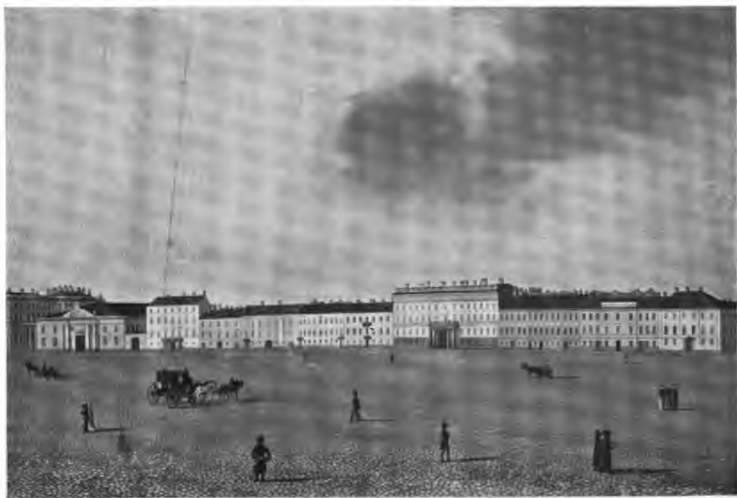
Марыновъ.—Площадь Зимняго дворца. (Изъ собр. С. С. Веткина).