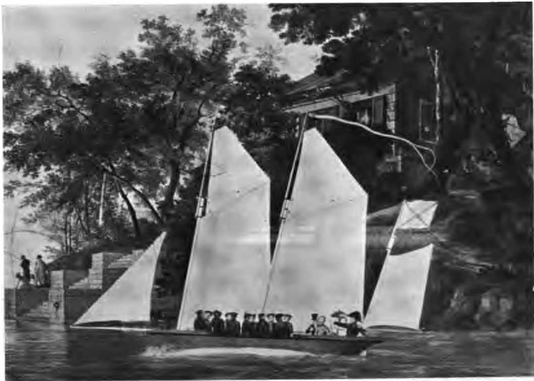
Г. Чернецовъ.—Катанье на лодкѣ. (Изъ собр. С. С. Боткина).