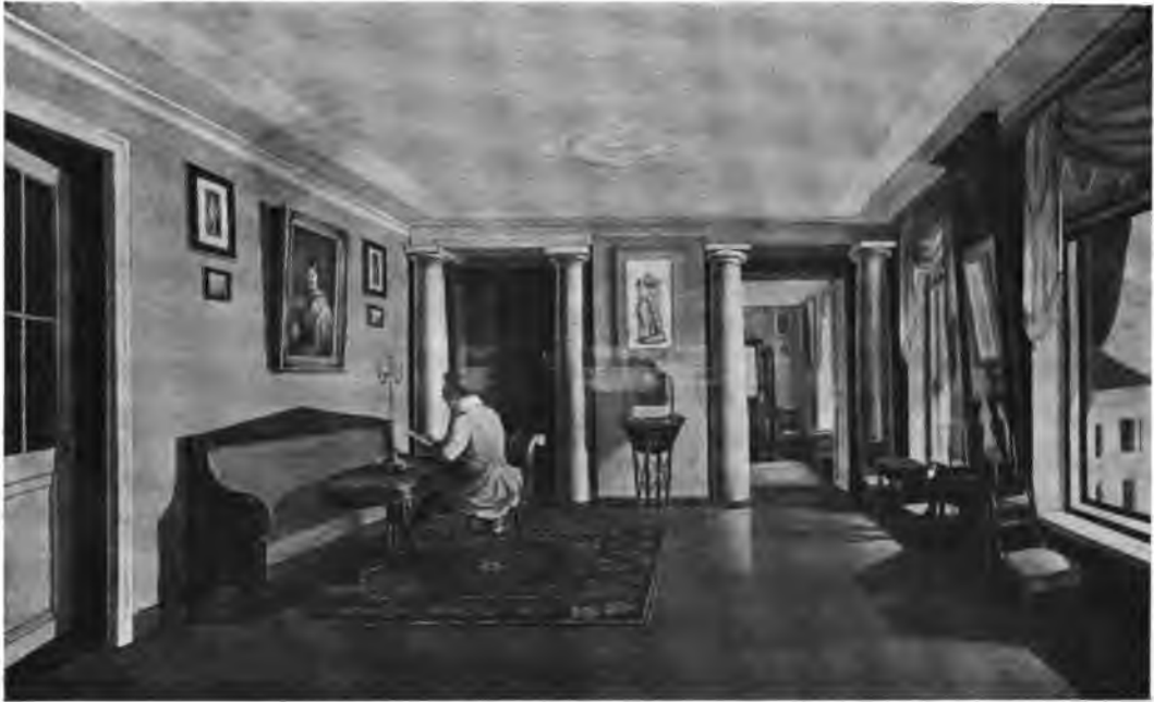
К. Зеленцовъ.—Перспектива комнаты. (Изъ собр. М. П. Фабриціусъ).