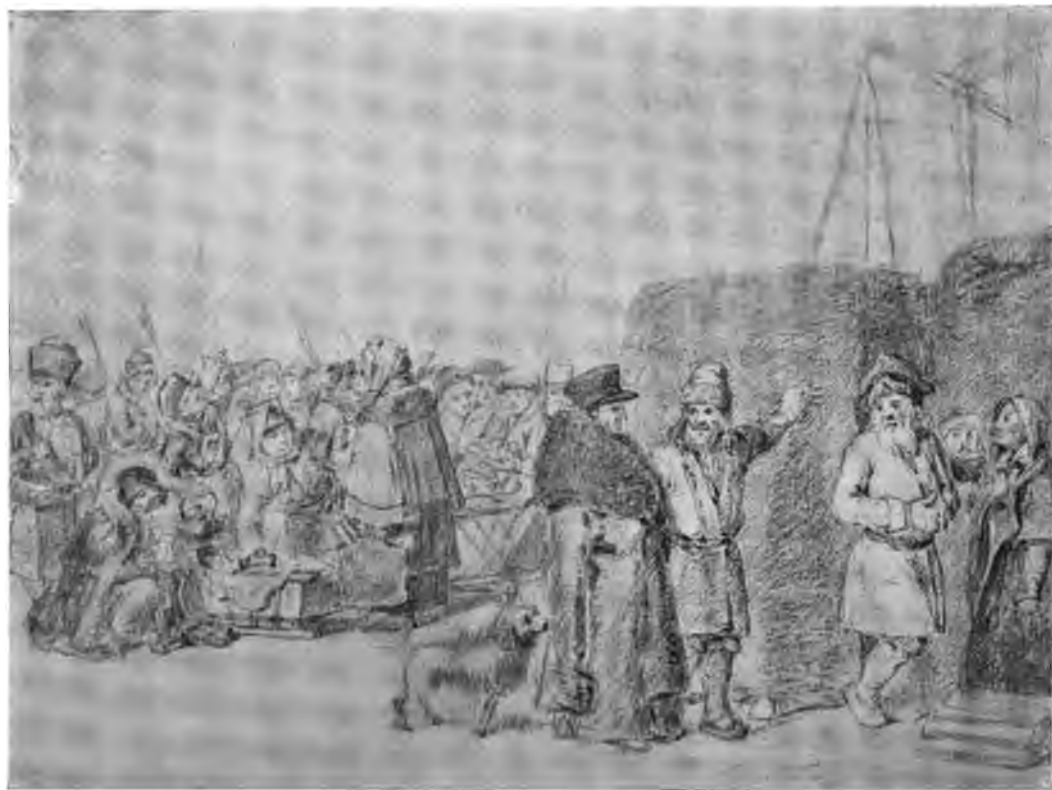
А. Г. Венециановъ.—Сцена изъ петербургской жизни. (Изъ собр. С. С. Богкина).