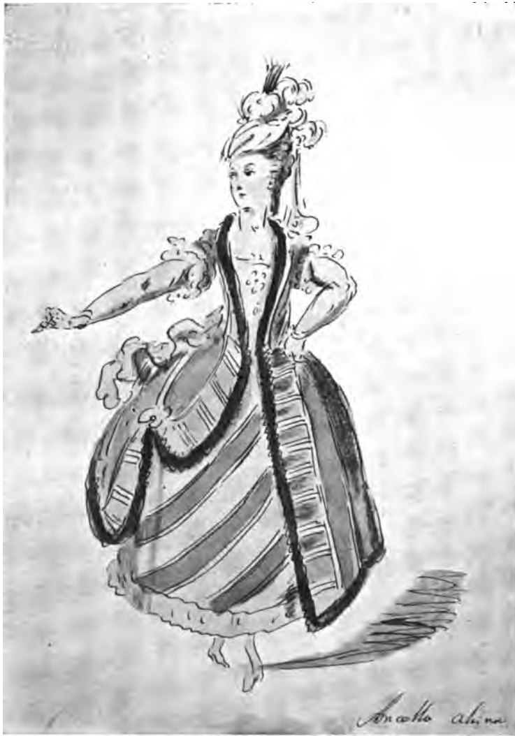
Театральный костюм время Екатерины II. (Изъ собр. К. А. Сомова).