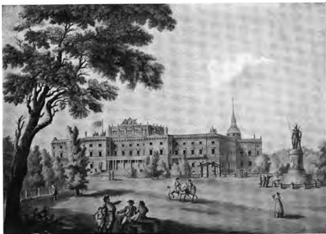
Апокрифное изображеніе Михайловскаго дворца..