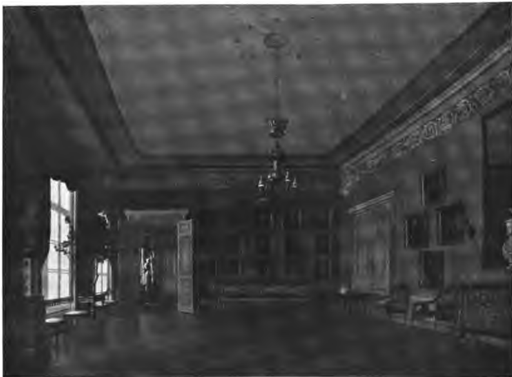
Михайловъ.—Комната Гатчинскаго дворца. (Изъ собр. М. П. Фабриціусъ).