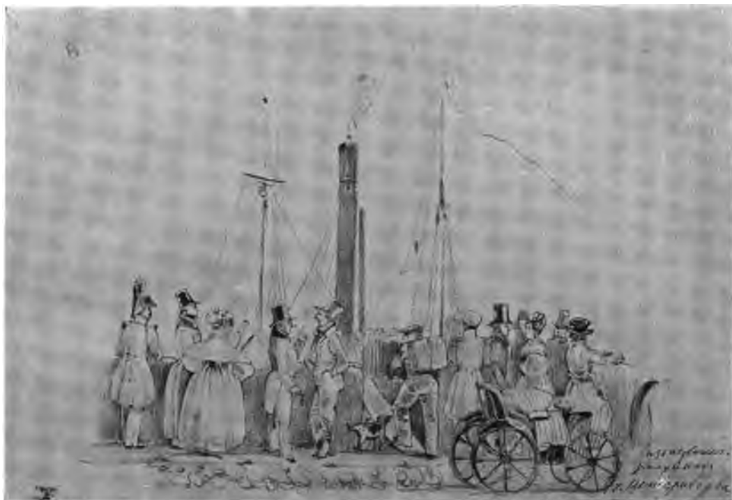
В. И. Штернбергъ.—Первый пароходъ въ Петербургъ. (Изъ собр. К. А. Сомова).