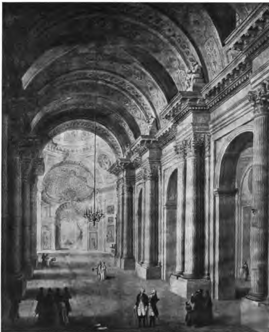
Даниловъ.—Внутренній видъ церкви св. Александра-Невскаго. (Изъ собр. Даниловой).