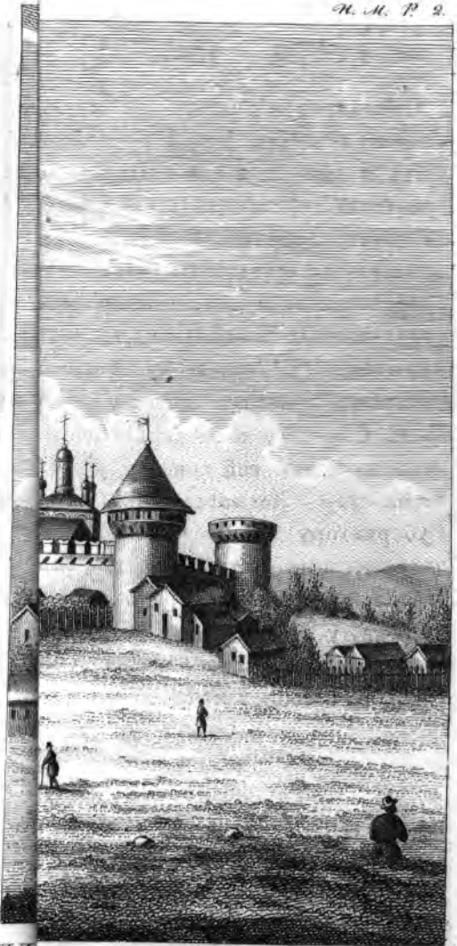
HIETPA BEJUKATO. Digitized by Google