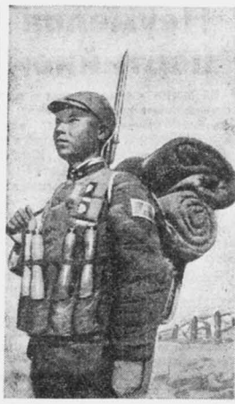
Китайский солдат в походном снаряжении.

НЬЮ-ЙОРК, 8 января. (ТАСС). Как сообщает агентство Ассошиэйтед пресс из Кристола (зона Панамского канала), на процессе германского шпиона Кухрига после выступления прокурора защита подала обжалование по делу о шпионаже. Судебный процесс устанавливает, что Кухриг 16 декабря прошлого года вместе с еще осужденным ранее другим германским шпионом Шаком проник на территорию форта Рандольф, где производил фотографирование важных военных объектов. Судебными показаниями установлено также, что Кухриг еще до этого времени пытался на небольшом рыболовном судне приблизиться к укреплениям форта Рандольф со стороны моря с целью произвести фотосъемку по заданию германской разведки.