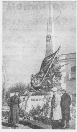
В г. Коростене (Житомирской области, УССР) открыт памятник легендарному командиру ЦСР.

Официальным языком в военных частях Аландских островов будет шведский (большинство населения Аландских островов говорит на шведском языке).