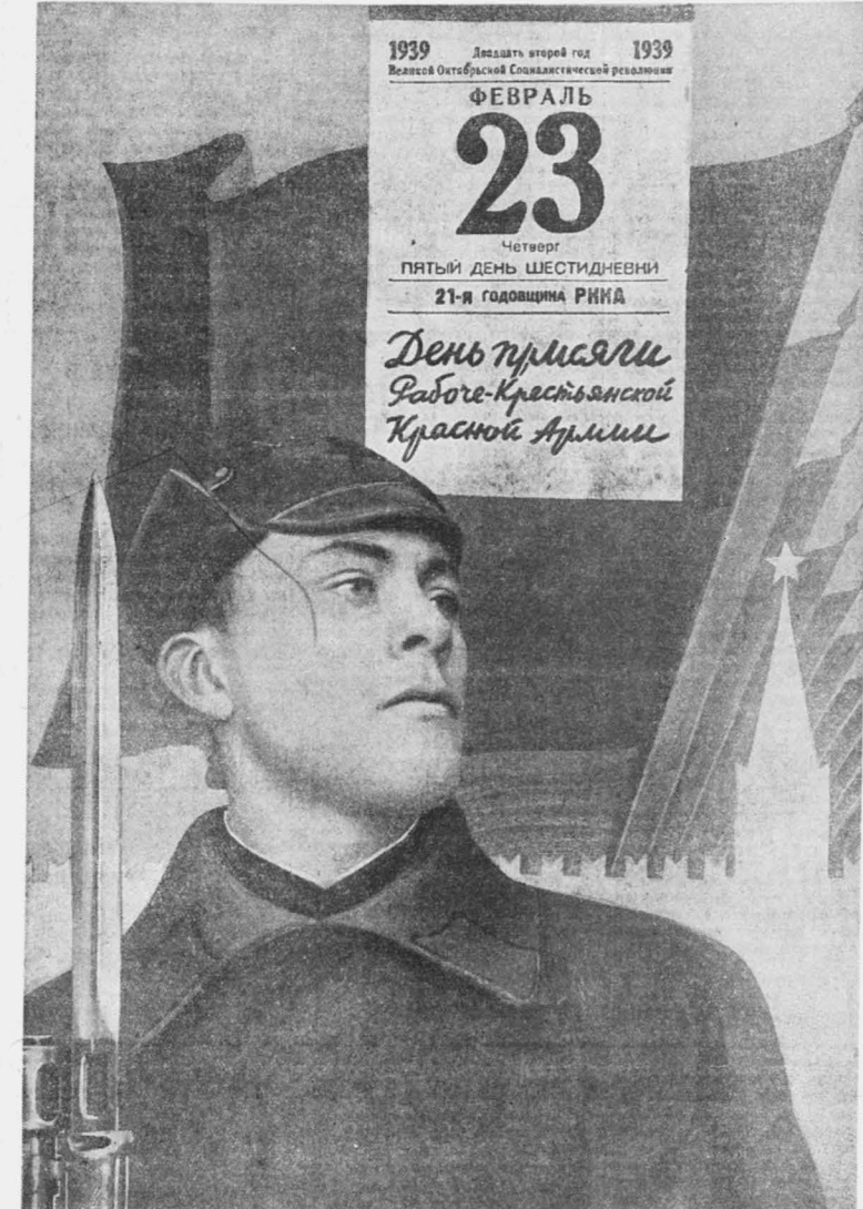
Монтаж худ. Г. Хонзоро.

На водном транспорте переписку будет произведена 17 января. Переписку персонал выделен из состава команд судов. (ТАСС).