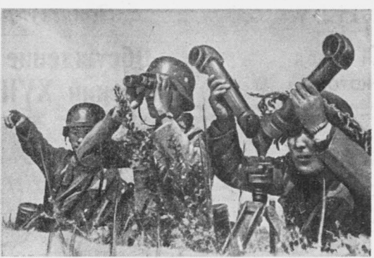
Командиры китайской армии наблюдают за боевыми действиями.

ЛОНДОН, 29 марта. (ТАСС). Как передает агентство Рейтер, премьер-министр Чемберлен сегодня в палате общин сообщил, что правительство решило увеличить численность территориальной армии с 130 тысяч человек до 170 тысяч человек. Чемберлен добавил, что по штатам военного времени территориальная армия будет увеличена и достигнет, следовательно, 340 тысяч человек.