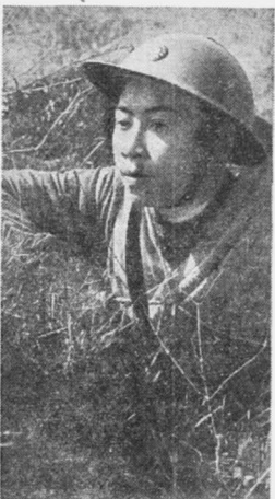
Китайские патриоты принимают активное участие в борьбе против японских захватчиков. На снимке — одна из курсантов китайской военной школы.

НЬЮ-ЙОРК, 15 апреля. (ТАСС). Руководители всемирной выставки в Нью-Йорке заявили, что они отклонили требование чехо-словацкого павильона. Руководители выставки указывают, что они, как и государственные департамент (министерство иностранных дел) США, не признают германский захват Чехо-Словакии и поэтому они разрешат открыть чехо-словацкий павильон под флагом Чехо-Словацкой республики.