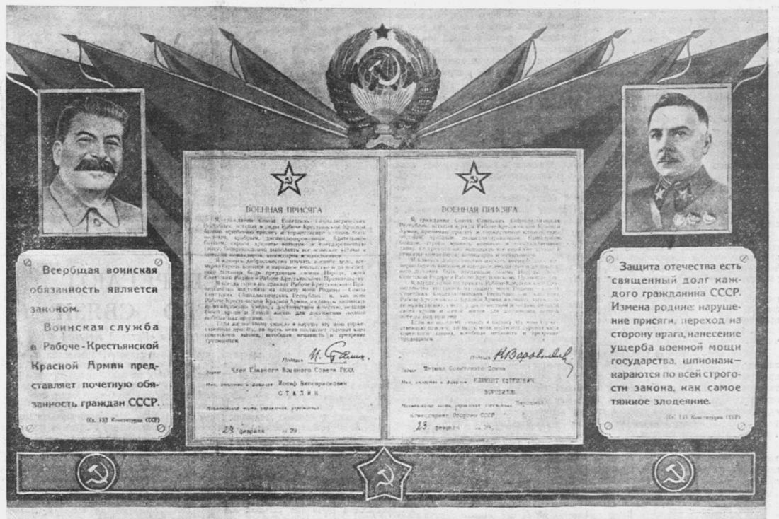
Планет, выпущенный Политическим управлением РККА и предстоящему очередному призыву в Красную армию.

На четырехмоторном корабле летчики Красной армии успешно закончили учебный перелет по маршруту Москва — Баку — Москва с одной посадкой в конечном пункте пути. Самолет лет в Баку через Сталинград, казачьи степи, вдоль побережья Каспийского моря.