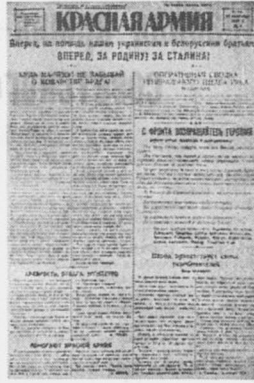
Первая страница ежедневной красноармейской газеты Украинского фронта «Красная армия» № 5 от 21 сентября 1939 г.

Капитан Милей посмотрел в бинокль. В окная станционного здания он заметил польские пулеметы.