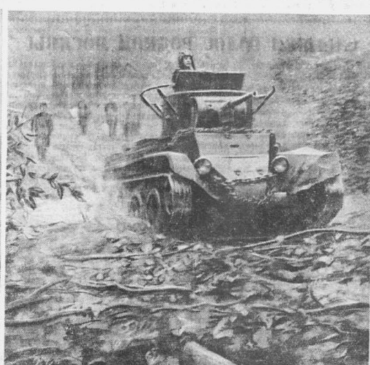
Части Красной армии в Западной Белоруссии.