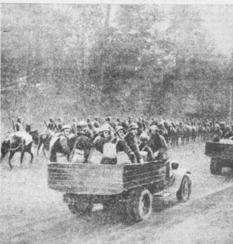
В Западной Белорусии. На снимках: слева — мотомехколонна Красной армии вступает в город Равно, справа — кавалерия и моторизованные части в походе.