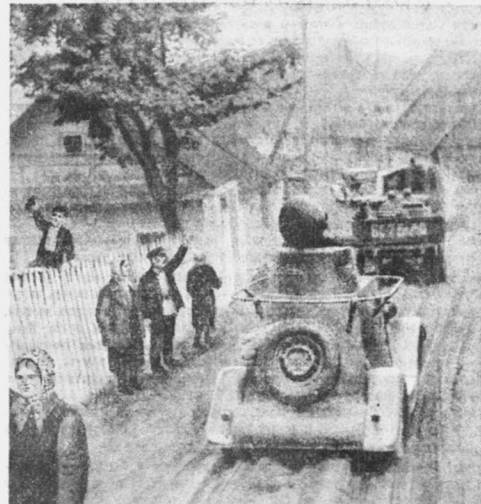
В Западной Белорусии. На снимках: слева — мотомехколонна Красной армии вступает в город Равно, справа — кавалерия и моторизованные части в походе.

И мы говорим нашим братьям — украинцам и братьям — белорусам, ждано интерпретируем жизнь страны социализма: «Вы хотите знать, что такое советский народ? Смотрите на его Рабоче-Крестьянскую Красную армию!»