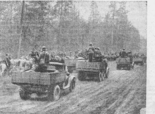
Части Красной армии в Западной Белорусии.