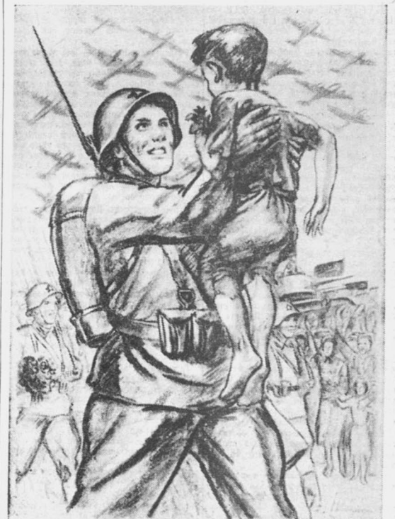
Человек с ружьем — страшный в прошлом, в сознании трудящихся масс, не страшен теперь как представитель Красной Армии и является теперь их же защитником.

Планет художника Новокренина, выпускаемый издательством «Искусство».