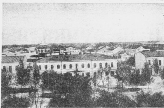
Города, занятые Красной армией. Слева — Брест-Литовск, справа — Белосток.

Эти самолеты могли бы противопоставить себя германской авиации и оказать ей серьезное сопротивление. Однако этого не случилось. Польская авиация была застигнута вражескими налетами германских самолетов на ее аэродромы, что привело к большим потерям материальной части в первые же дни войны. Кроме того необходимо отметить, что новые самолеты поль-