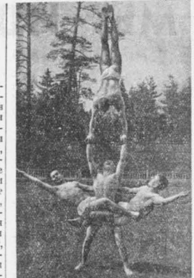
Группа физкультурников N части Московского военного округа готовится к вечеру краснойармейской самостоятельности в день 1 мая.

Адрес: г. ГОРЬКИЙ 7, д/лиц № 145. КОМАНДОВАНИЕ УЧИЛИЩА.