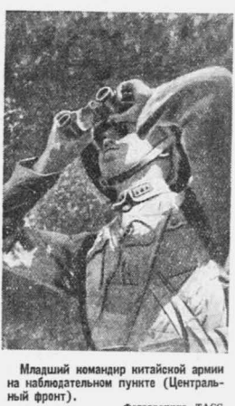
Младший командир китайской армии на наблюдательном пункте (Центральный фронт).