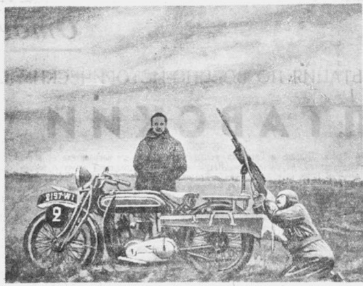
Во французской армии испытывается легкий пулемет для стрельбы по воздушным целям с мотоциклета.

ЛОНДОН, 9 июня. (ТАСС). Газета «Дейли Экспресс» сообщает, что окончательное решение назначить парламентские выборы в Англию на ноябрь 1939 г., если только не произойдет серьезных изменений в общеевропейской обстановке.