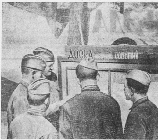
В часы массовой работы. Курсанты подразделения, где политруком тов. Васин, знакомятся с последними новостями на доске текущих событий (Белорусский особый военный округ).