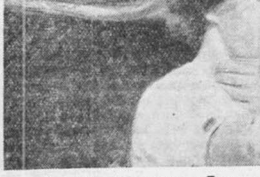
Авиационный праздник в Тушино. На снимке: зрители наблюдают за полетами.