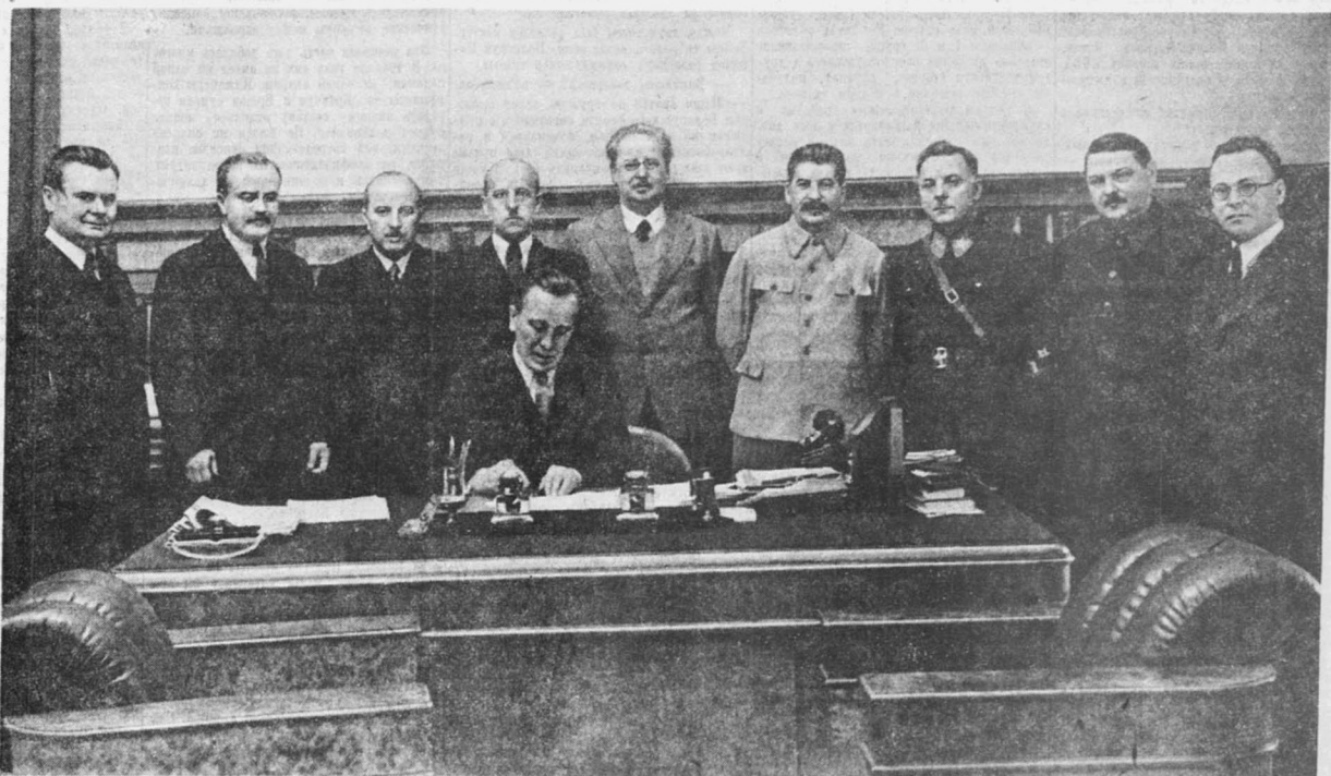
Подписание договора о передаче Литовской Республике города Вильно и Виленской области и о взаимопомощи между Советским Союзом и Литвой. Подписывает договор г-н Урбисис. Стоят (слева направо): г-н Натвиенюс, тов. Молотов, г-н Бизаускас, генерал Раштинис, товарищи Петемини, Сталин, Ворошилов, Жданов и Лозинский.

Советско-литовский договор — это новая победа сталинской политики мира. В непосредственном участии товарища Сталина в подготовке новых актов мира народы видят залог их особой прочности и действительности. Советско-литовский договор создал новые предпосылки для дальнейшей победы Советского Союза в борьбе за мир, для дальнейшего укрепления обороны нашей страны, для усиления мощи Красной армии и Военно-Морского флота.