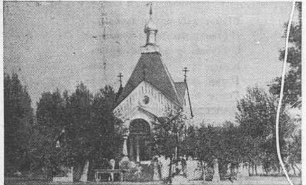
Памятник-часовня на Монастырском урочище в честь защитников Азова