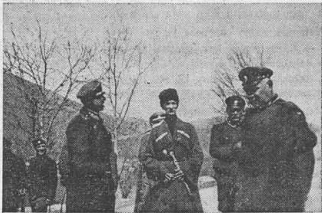
Кубанский Атаман ген. В. Г. Науменко среди офицеров 1-го каз. полка.

Не знаю, дойдут ли до вас эти строки, но я безгранично хочу вас приветствовать. Не скрою от вас о том, что я старый казак, как малыш казаченок бегал от моста к мосту, с одного конца города к другому, что-бы пови-