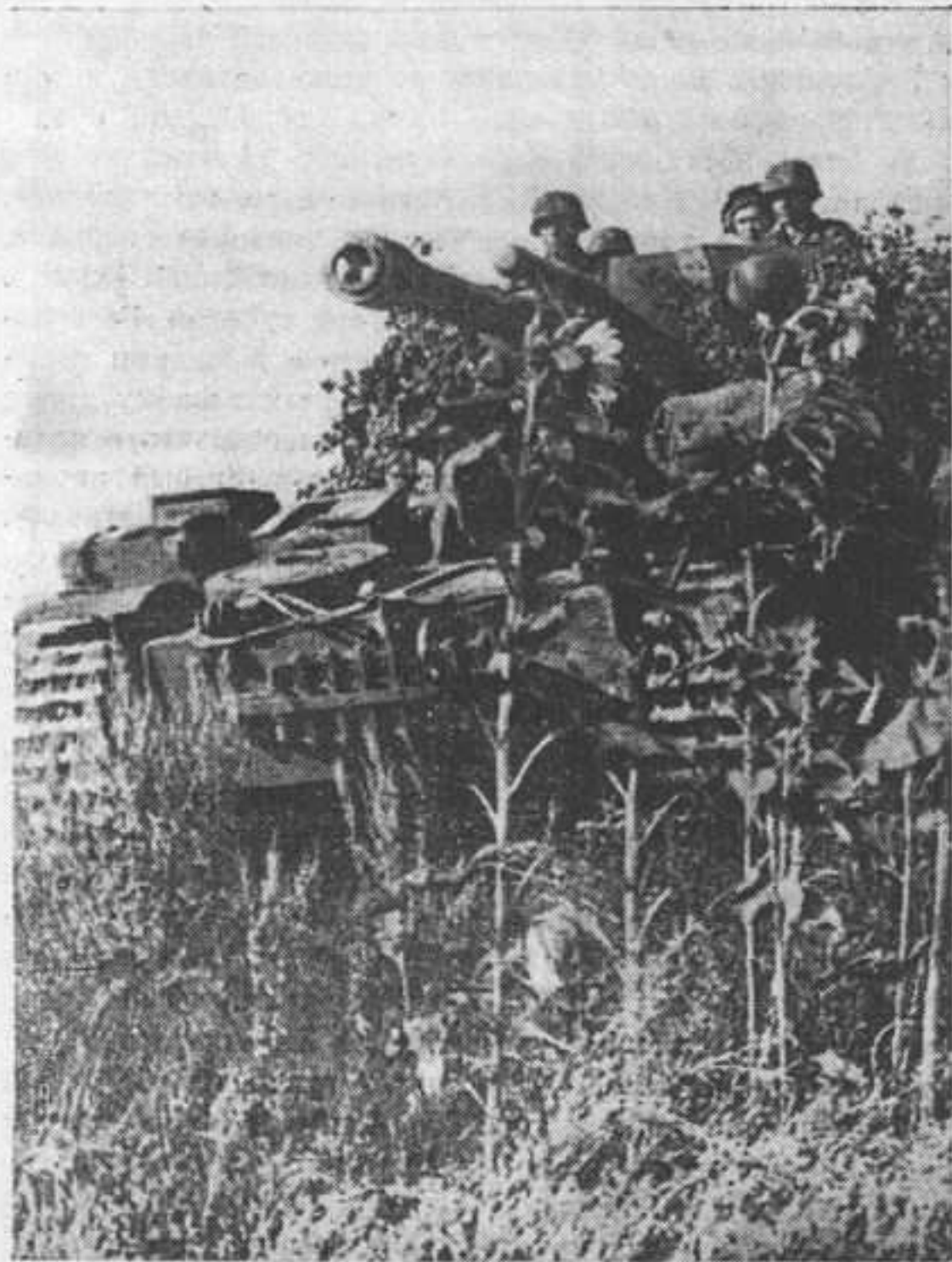
Гаубицы на самоходном лафете искусно замаскированы цветами и зеленью

Кубанский боец сделался образцом для всего фронта и отечества. Сохраните в себе и в дальнейшем дух Кубани и будете вы тогда всегда наводить ужас на врага. Я горжусь вами».