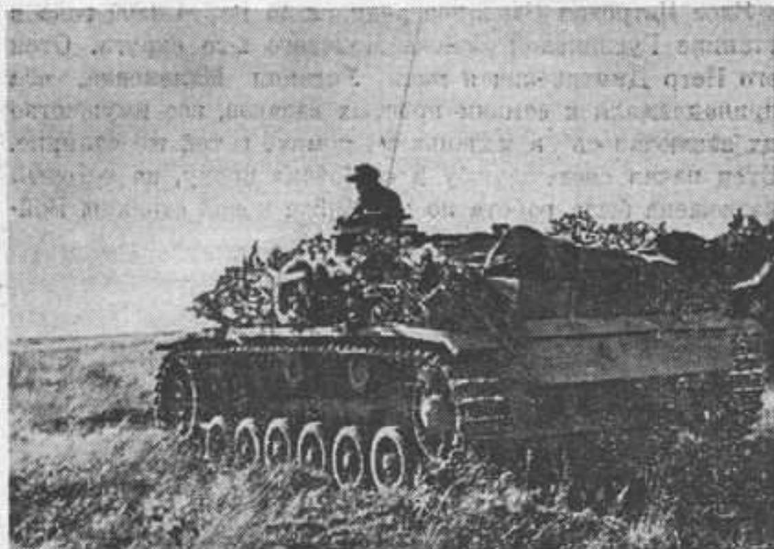
Первое орудие из штурмовой артил. колонны выезжает на позицию