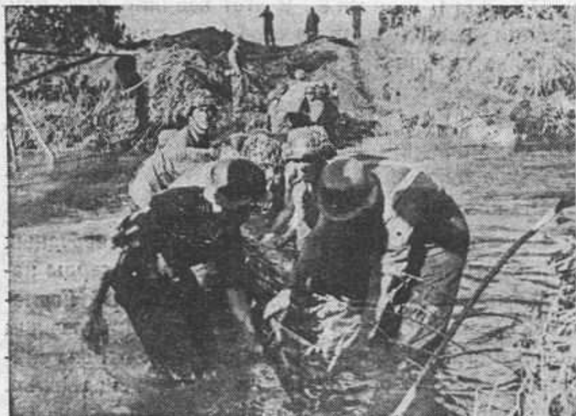
Саперные войска готовят на реке переправу для танков