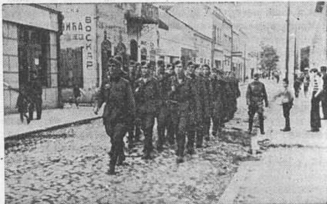
На улицах Белграда

О борьбе казачьих полков против коммунистических банд в Сербии военный корреспондент пишет следующее: «Не подлежит никакому сомнению, что использование добровольно сражающихся на стороне немцев казачьих частей, причем не на территории Советского Союза, представляет собой нечто новое в этой войне. Если бы эти люди даже и не поняли, что освобождение их родины не зависит от тактических отступлений и контрнаступлений, а что судьбу народов Востока решает исход войны вообще, то им все таки было бы не трудно понять, что борьба на новых фронтах имеет не менее важное значение. Готовность казаков бороться на этих отдаленных от родины фронтах доказывает глубокую веру в окончательную победу германского дружина. Этому решению способствовал, правда, и тот факт, что в отдаленной на тысячи километров стране враг оказался тем же самым. Коварные методы коммунистических банд в лесах и оврагах Кroatии, Боснии и Сербии ничем не отличались от тех, которые применяли советские банды в лесных и болотистых местностях за главной боевой линией среднего участка Восточного фронта. Легко передвигающиеся, непритязательные в отношении собственных жизненных удобств, приспособляющиеся к любым условиям боя, казаки являются опаснейшими противниками красных банд и ожесточеннейшими врагами большевизма. И не только потому, что каждый из них хочет тысячекратно отомстить, а так же и потому, что в каждом из этих людей живет святое убеждение, что не может быть никакой свободы без уничтожения советской системы».