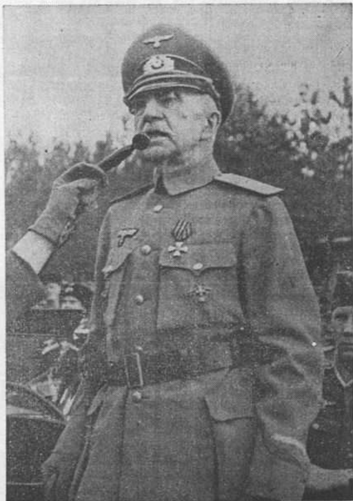
Генерал П. Н. Краснов произносит в микрофон речь перед чинами Н-ской казачьей дивизии.

Загорелая, мозолистая, зачугунелая в боях и походах, в схватках с врагами и работах рука ста-