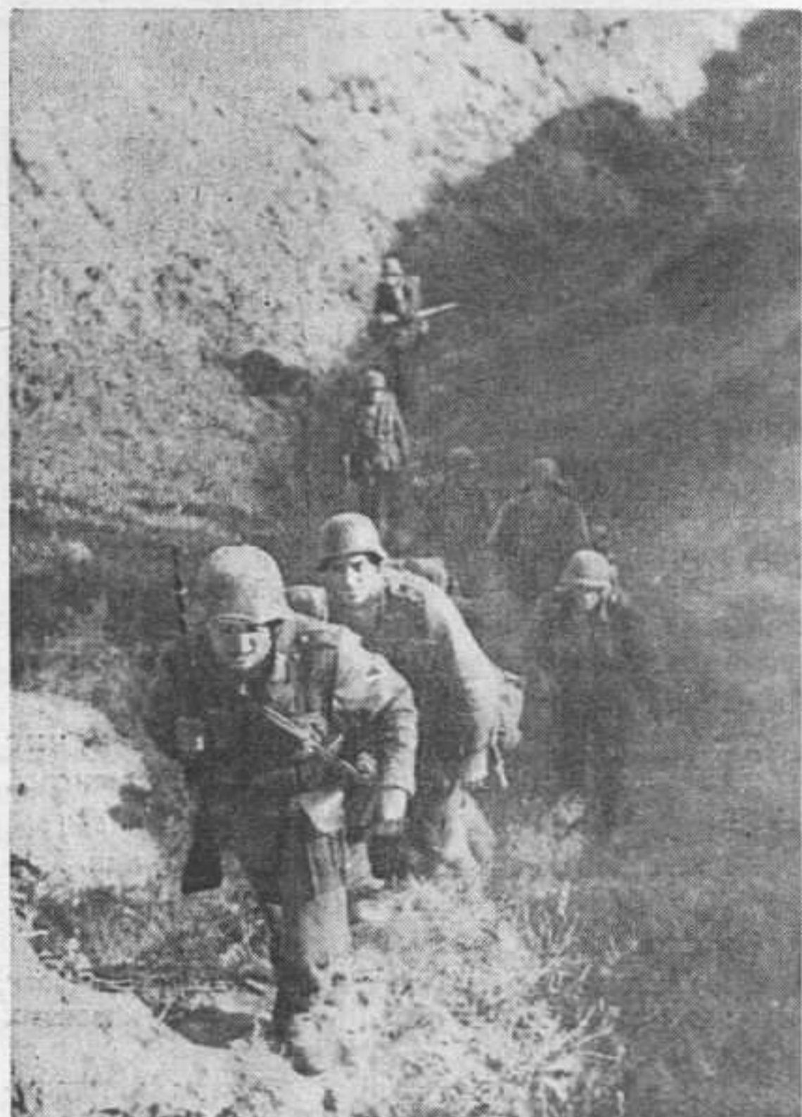
Гренадеры по ущелью пробираются в тыл противника на разведку