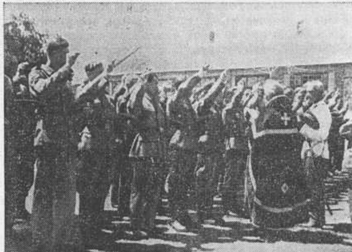
Новоприбывшие в одну из частей казаки приносят присягу.