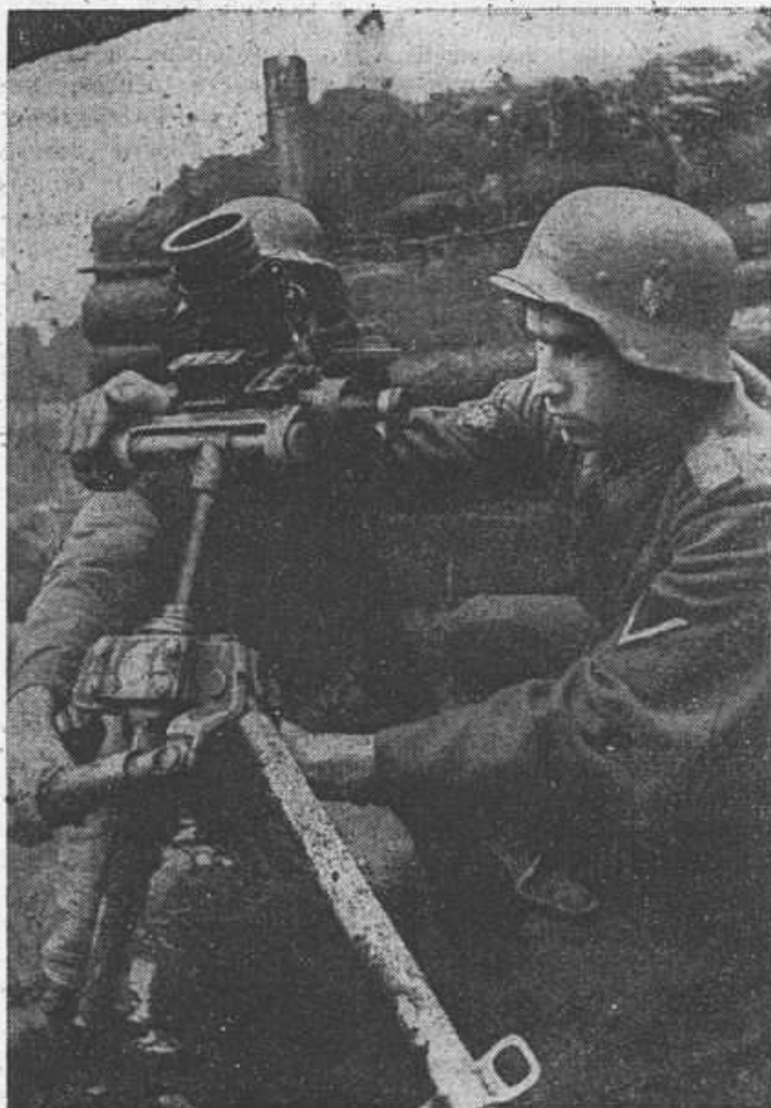
Гранатометатель на позиции