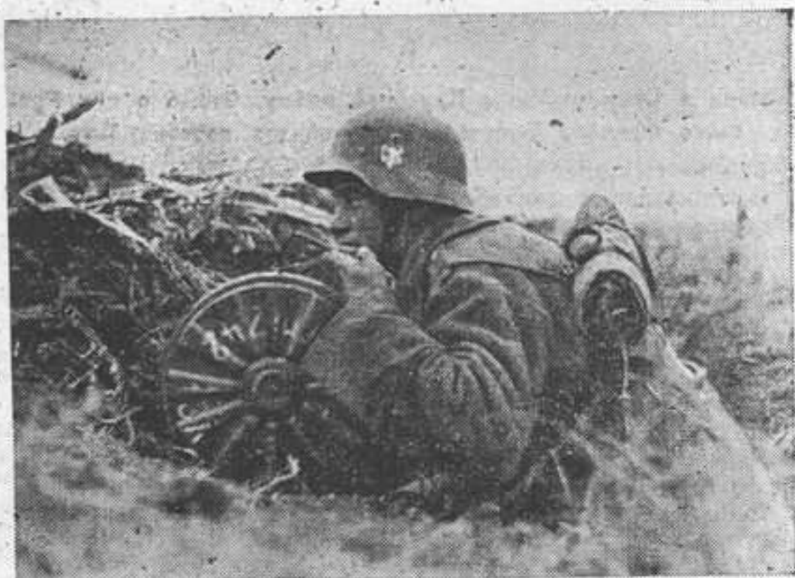
Минометчик за работой