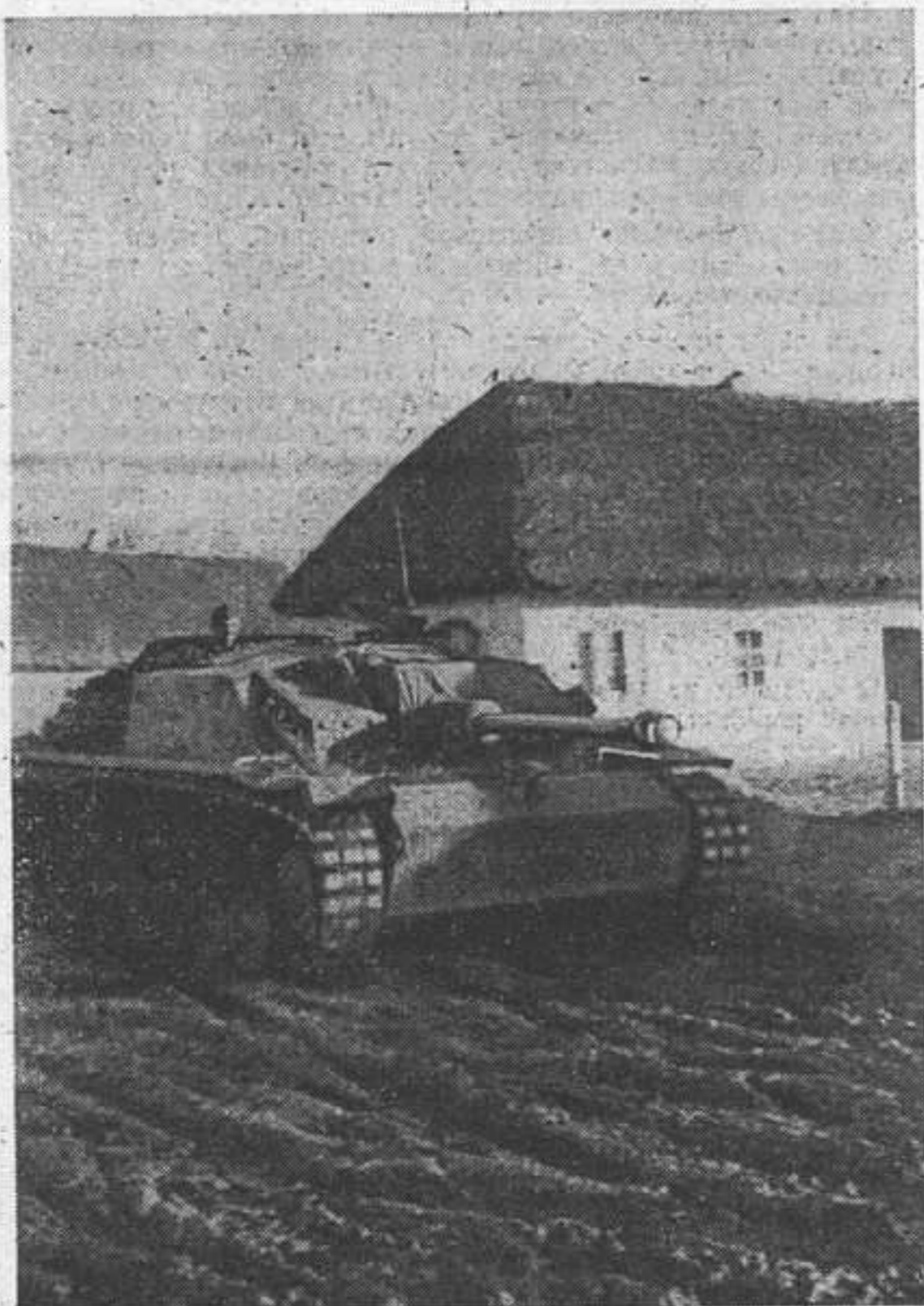
Немецкий танк проезжает через украинское село

тельное напряжение всех сил, которого она требует, составляют основную тему речи Фюрера 8 ноября прошлого года.