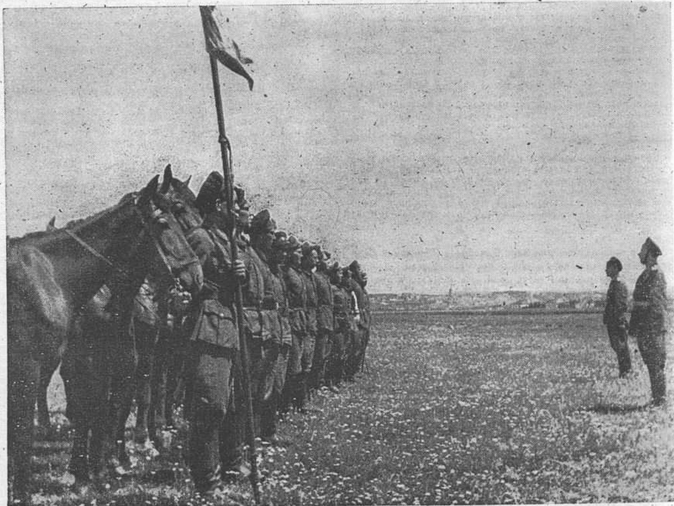
Донцы на Украине в 1943 году