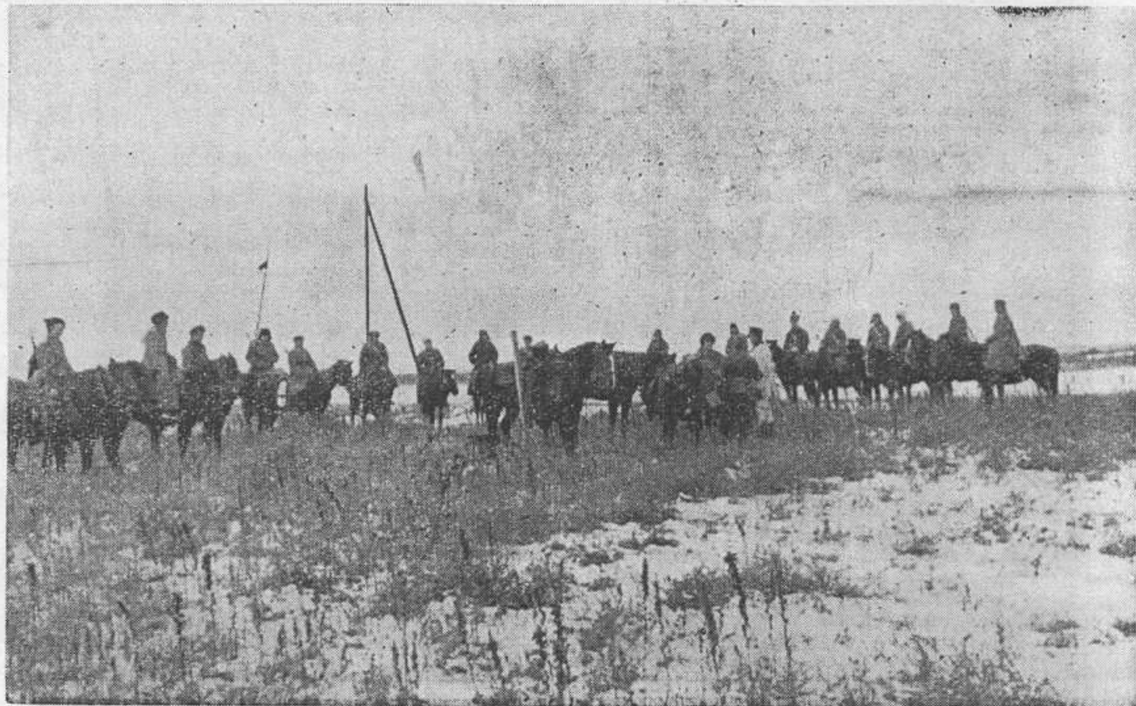
В степных просторах