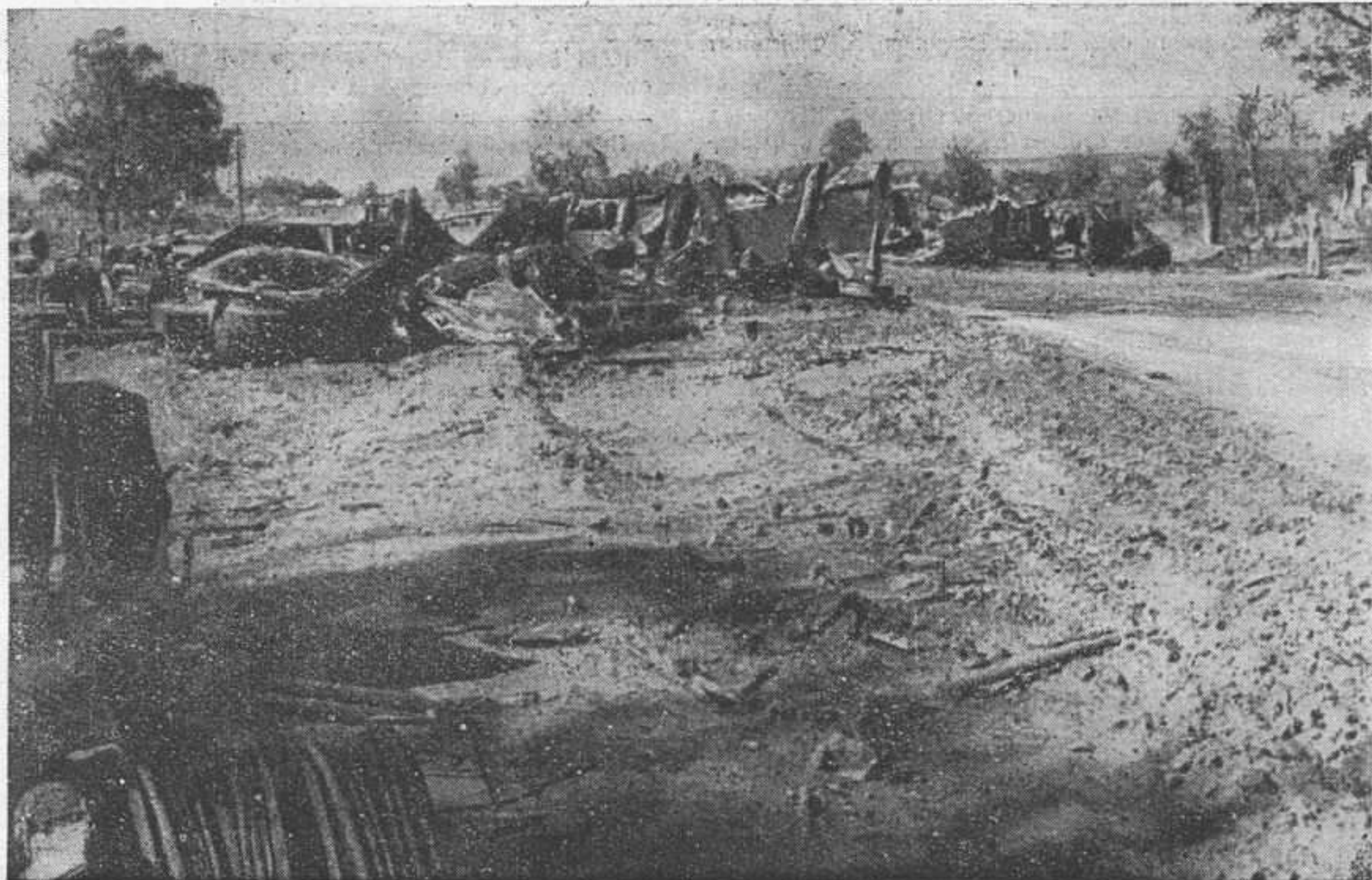
Кладбище советских танков