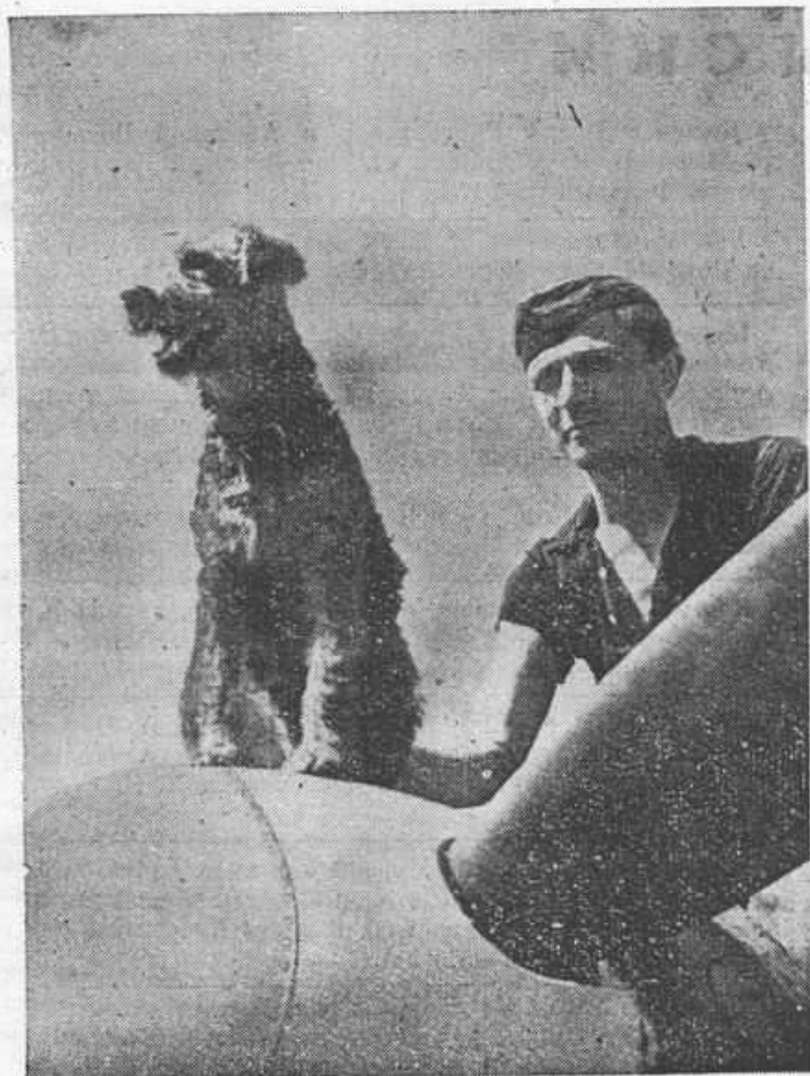
«Штруппи» — общий любимец одной команды летчиков-истребителей