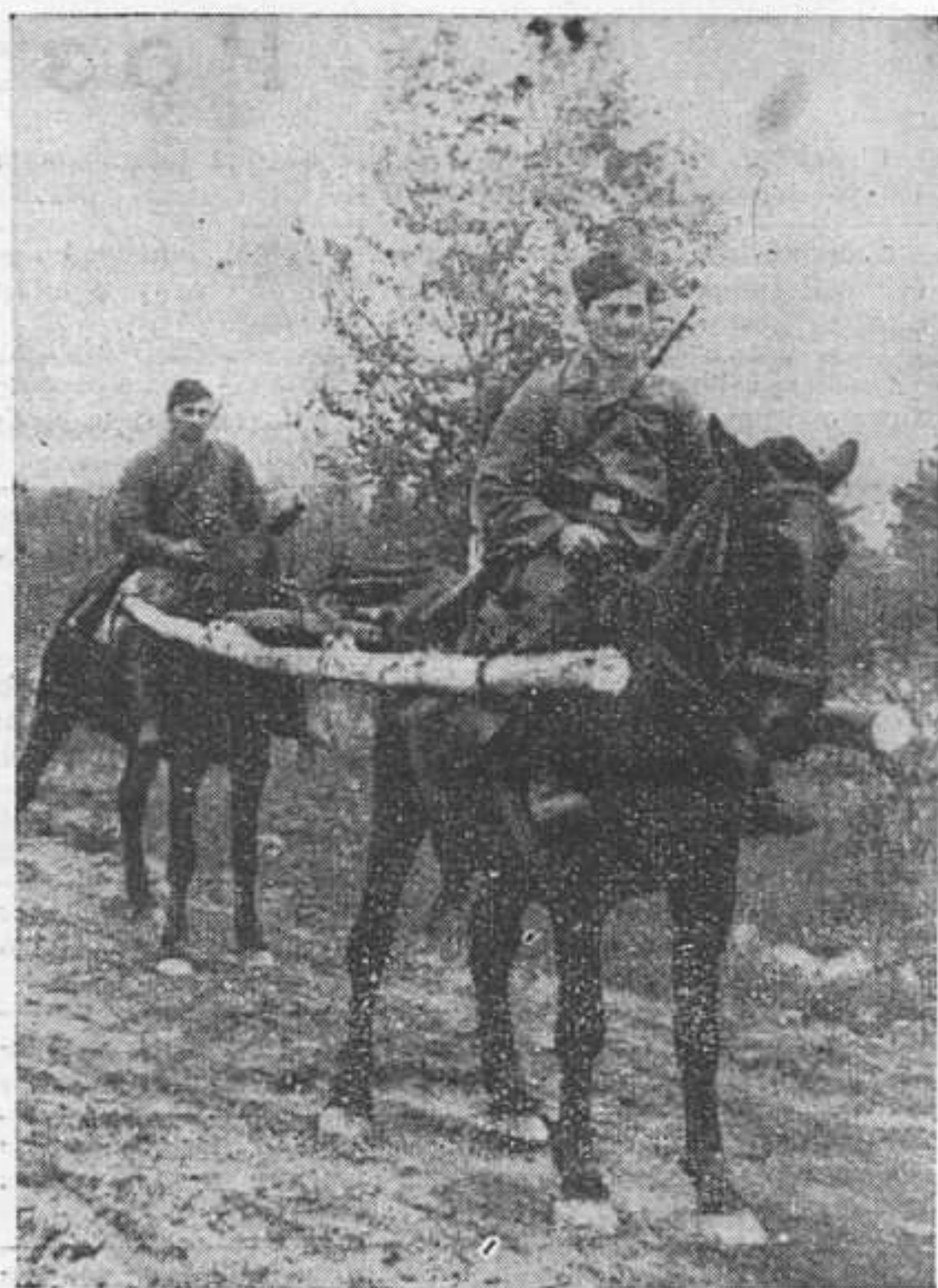
Перевозка раненых на восточном фронте с передовых позиций в полевой лазарет