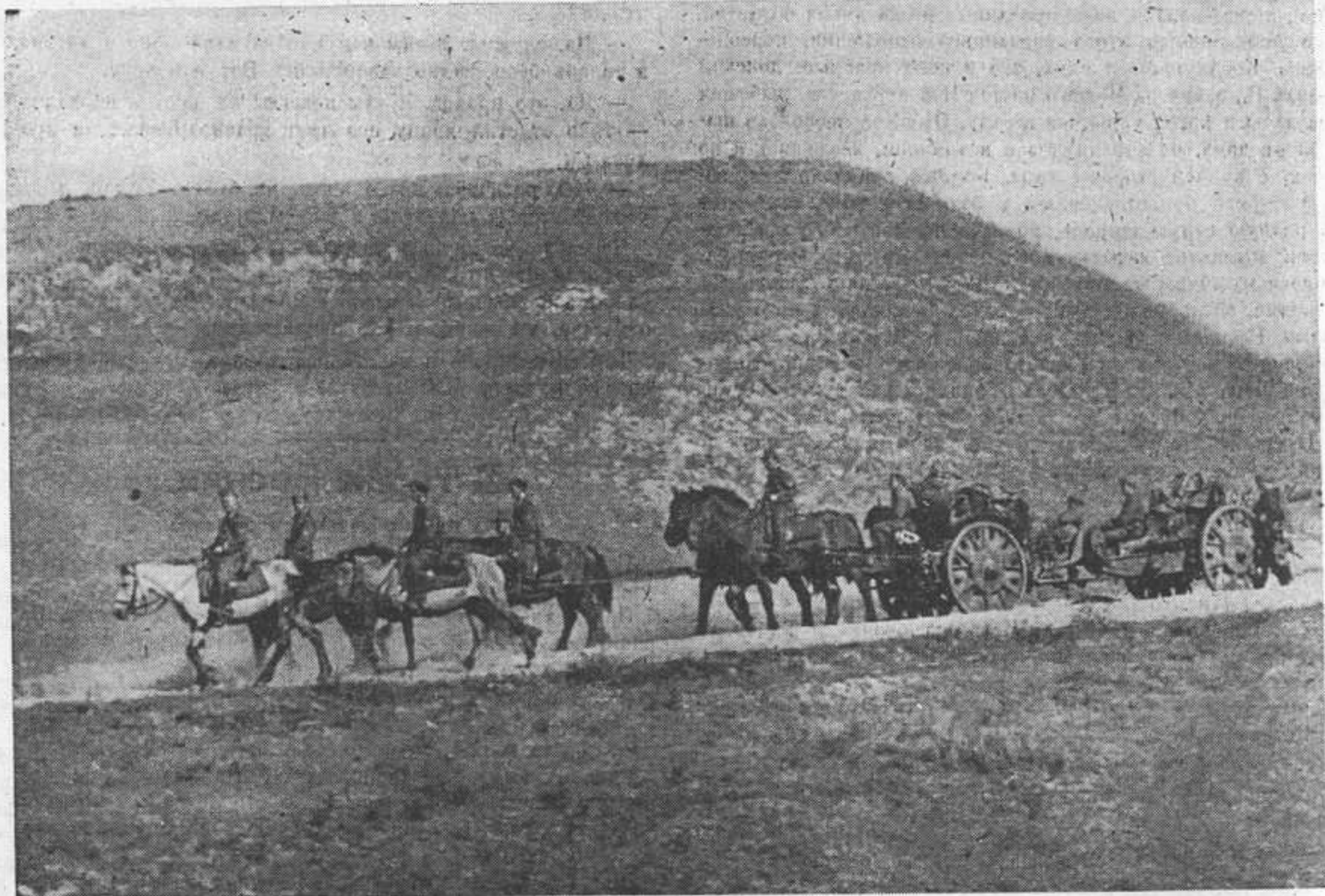
Взвод горной батареи меняет позицию