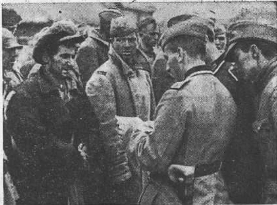
Пестрая кампания. Группа пленных состоит из партизан и чинов регулярной Красной армии, совместно участвовавших в одном бою

После одного сражения, по свидетельству захваченного в плен красного офицера, из 300 наступавших красноармейцев уцелело лишь 14 человек