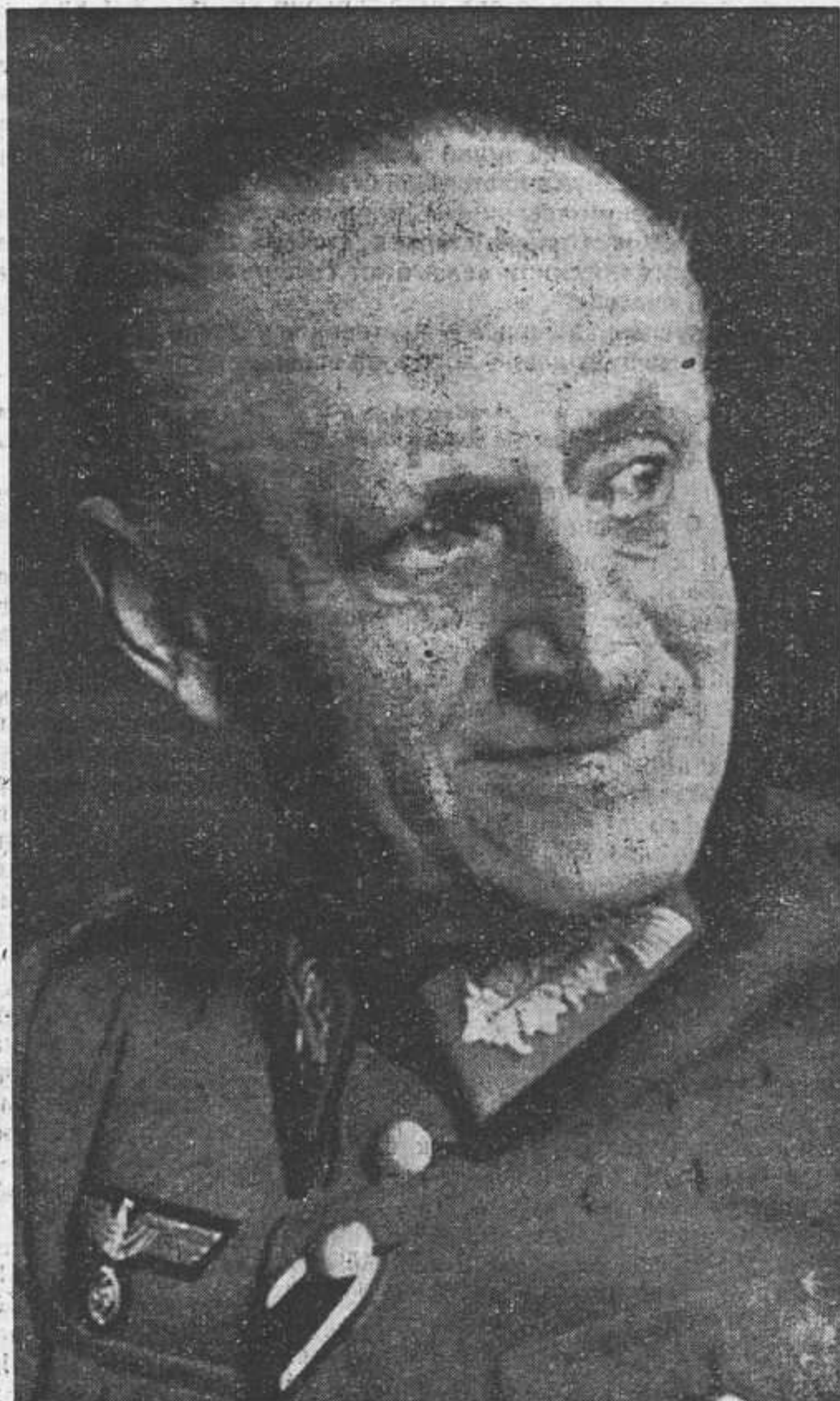
Генерал от кавалерии Кестринг назначенный Верховным Командованием Генералом Добровольческих Войск

Адрес редакции: „Kosakenposten“ F.P. Nr. 02306