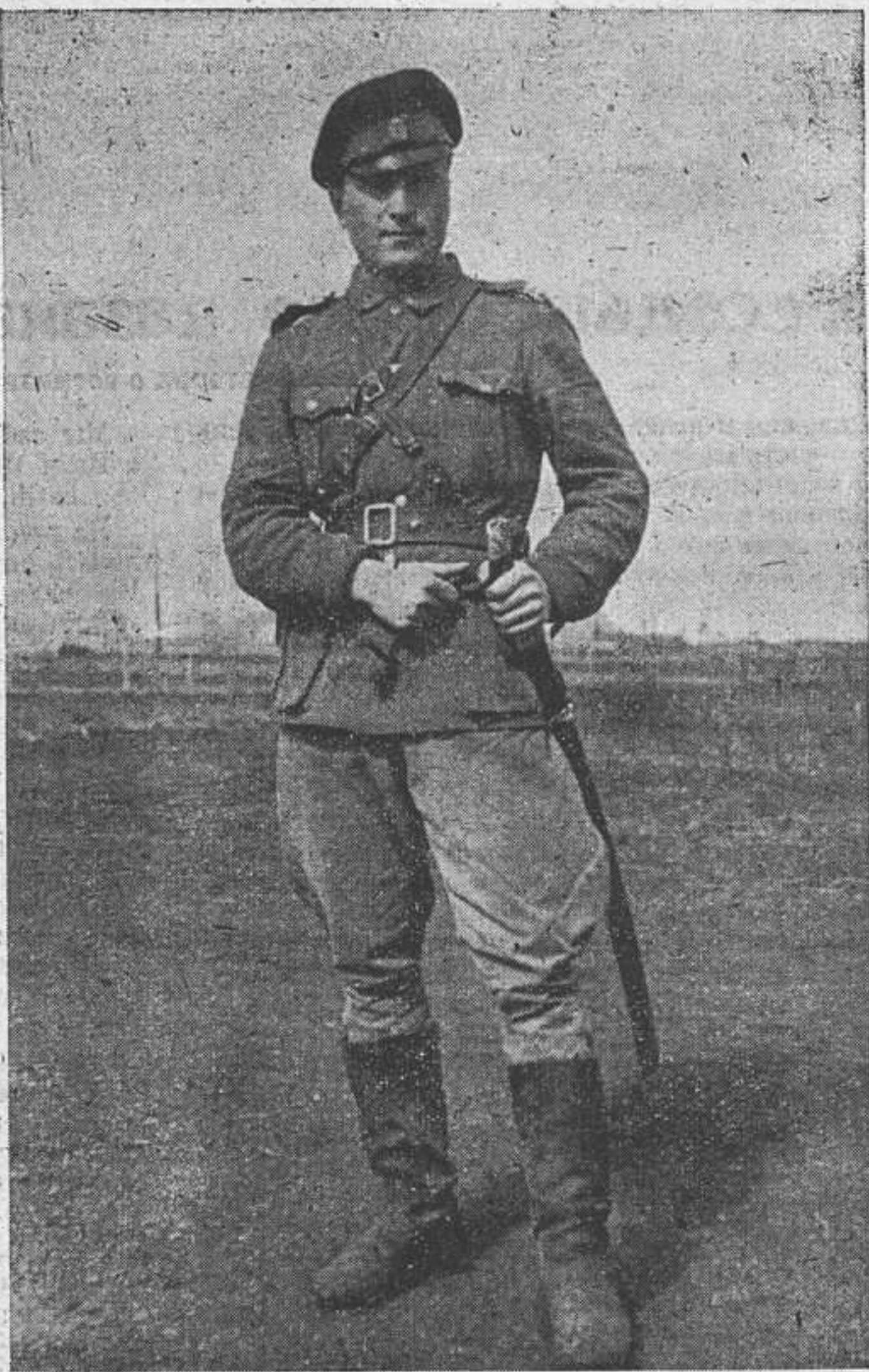
Кубанский офицер новых казачьих частей

Адрес редакции: „Kosakenposten“ F.P. Nr. 02306