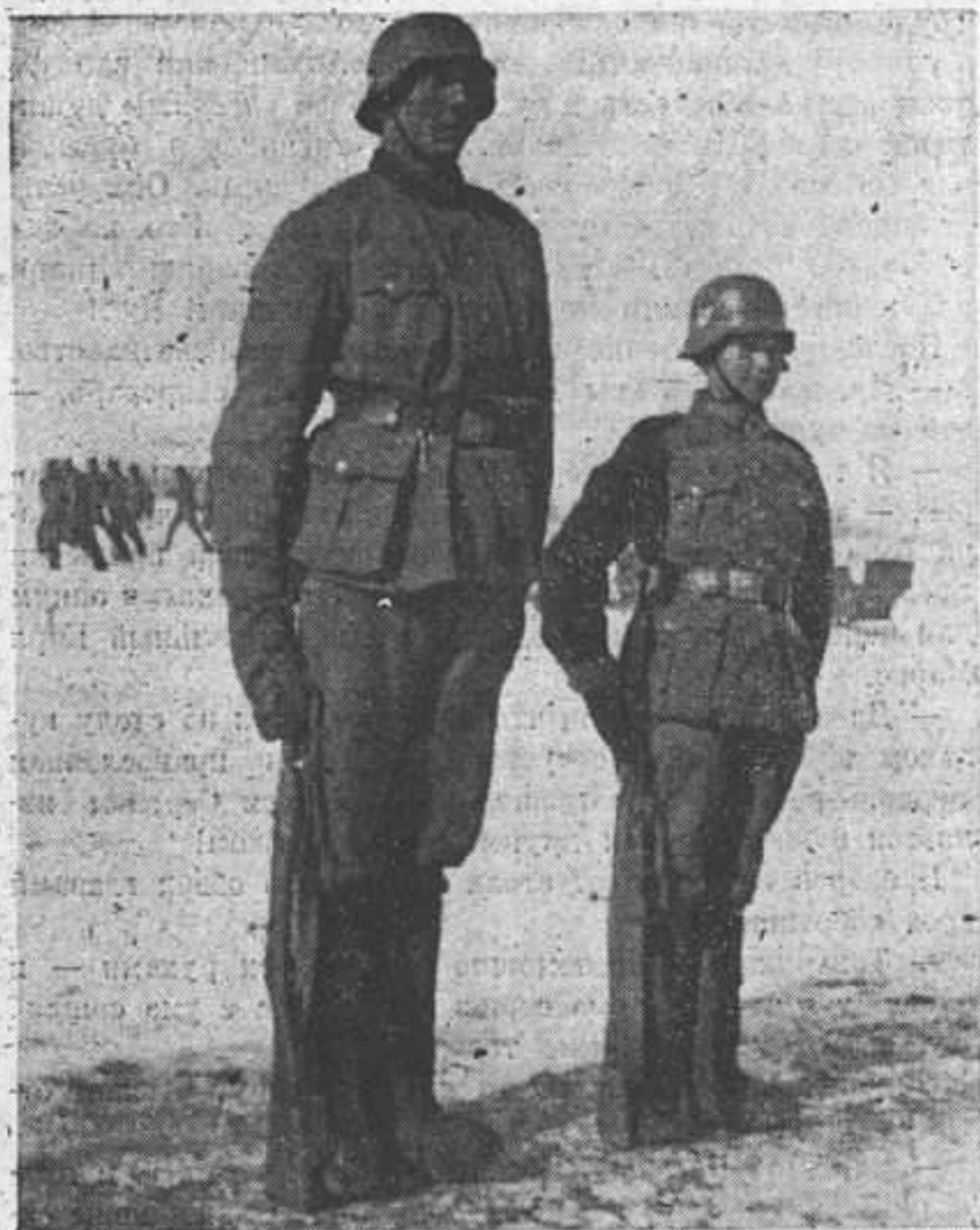
Разница в росте и в возрасте не мешает ни тесной их дружбе, ни совместной боевой работе в одной из казачьих частей.

Снова лес... Высокие стройные сосны, красивые зеленые елочки, белые березки, черная грустная ольха с голыми ветвями. Кругом лес, вверху мутное небо, внизу снег. Казалось, ехали более часа. Впереди идут Бабин и Новиков, сзади Девкин, а за ним казаки, сани, а следом за ними опять казаки. Снова лес, только гуще пошел, деревья тоньше и выше, снегу меньше. Только вперед. Ближе к Линово, в казарму... В. Никонов