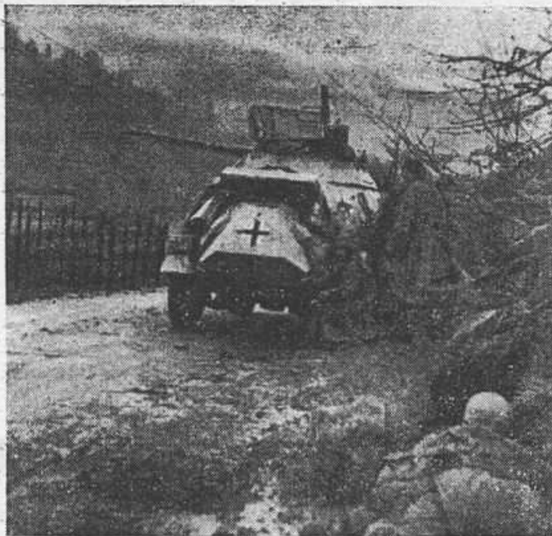
Бронеавтомобиль открыл огонь по противнику

В то время, как большевики с величайшими затратами людей и материала все время продолжают применять свою тактику перенесения главной тяжести атак из одного пункта в другой, германцы для восстановления положения ограничиваются доставкой к соответствующим участкам фронта весьма незначительных подкреплений. Весьма характерно, что этого незначительного подкрепления оказывалось достаточно во всех случаях, даже при положениях, казавшихся сначала весьма угрожающими, и что эти резервы всегда обеспечивали германскому командованию возможность снова прочно взять в свои руки инициативу. Советские потери за время с начала наступления 5 июля и по конец 1943 года, по осторожной оценке и по заслуживающим доверия данным, могут быть определены в три миллиона человек. Бросается в глаза очень высокий про-