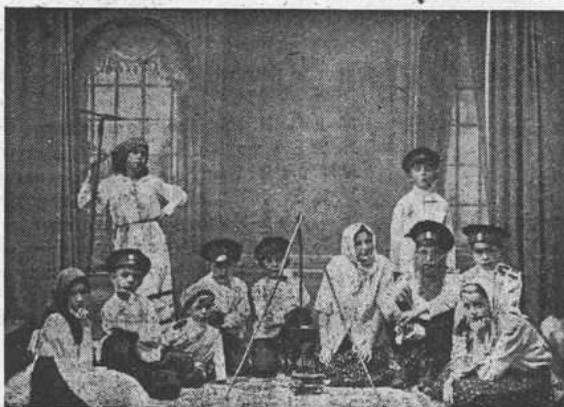
Калединская казачья станица в г. Крезе (Франция), в октябре 1936 г. устроила вечер по случаю Донского и Кубанского войсковых праздников. Один из номеров вечера — живая картина, участниками которой были дети членов станицы.