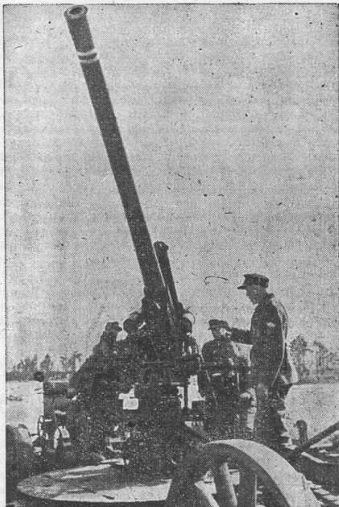
Казаци-артиллеристы у тяжелых орудий зенитной батареи