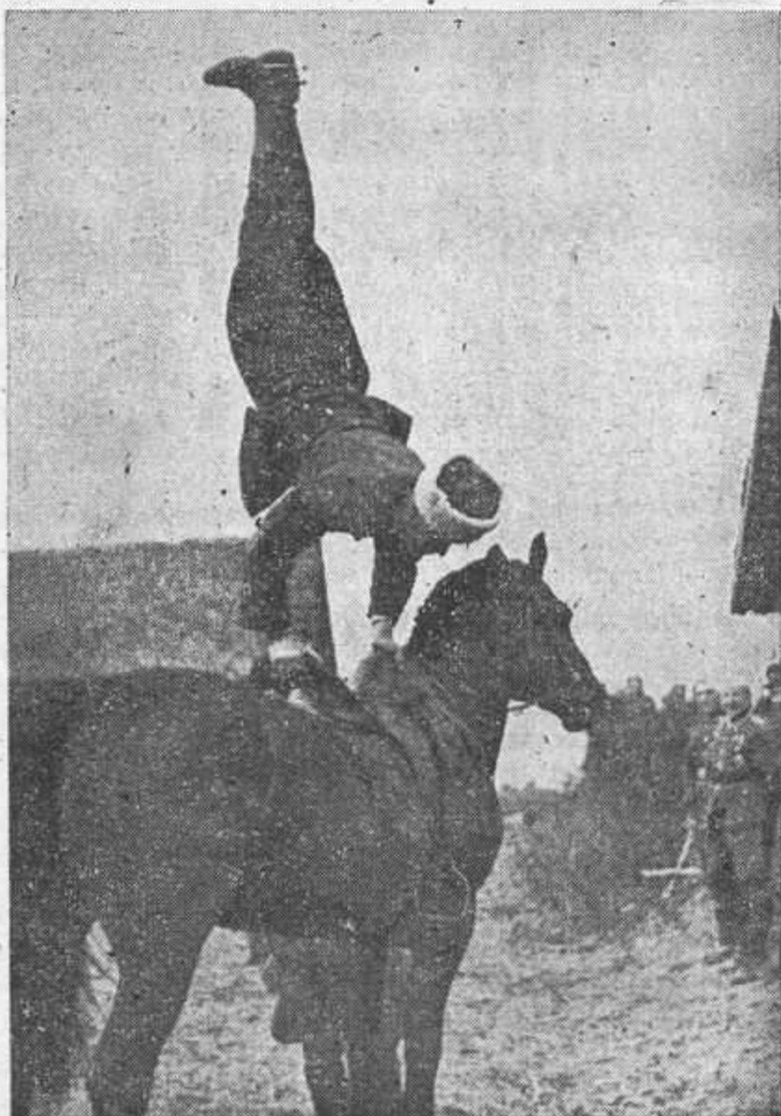
...«Ловкость, сметна и сноровка — Весь капитал у казака»...

Во время продолжительной стоянки в районах Ракитянского (Белоцерковский округ) казаки помогли местным жителям в весенних работах. Командир полка решил использовать лошадей для вспашки огородов местному населению.