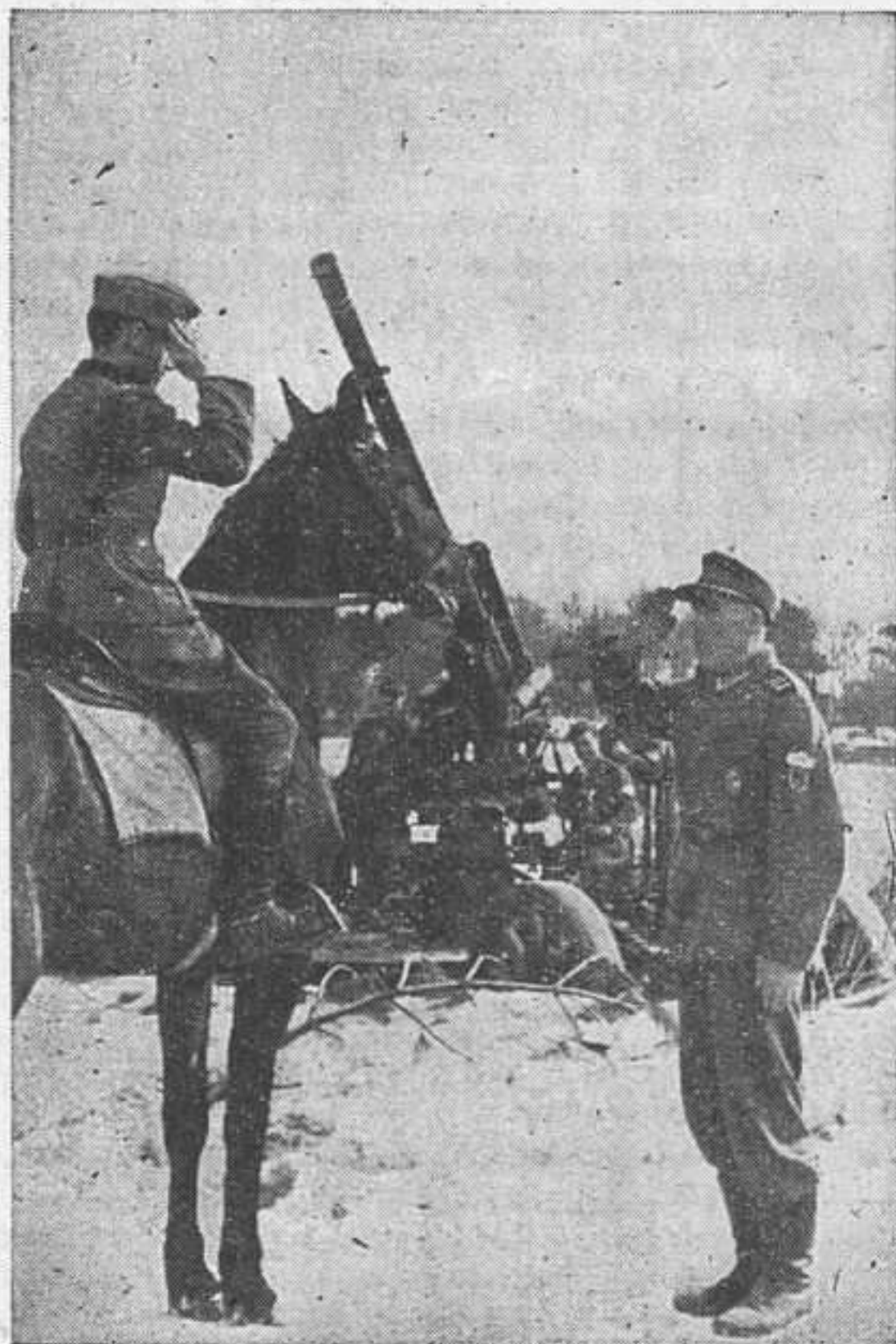
Казачий урядник рапортует начальству о состоянии вверенного ему поста