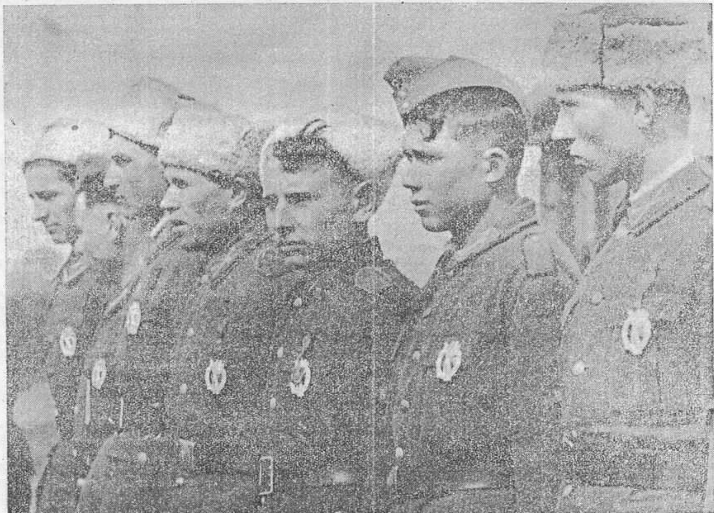
Два года на фронтах освободительной войны