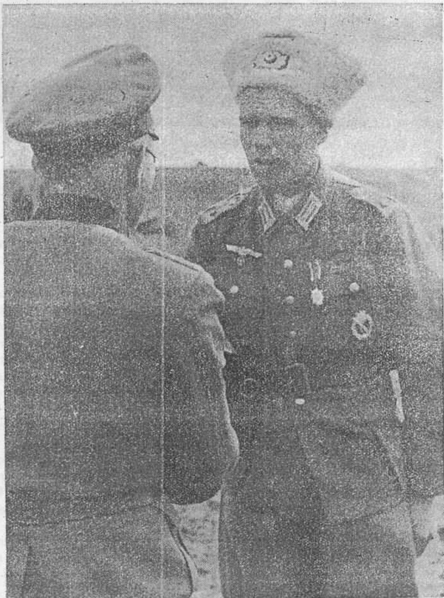
Командир батальона награждает казачьего офицера знаком «Штурмбейден»

Адрес редакции: „Kosakenposten“ F. P. Nr. 02306