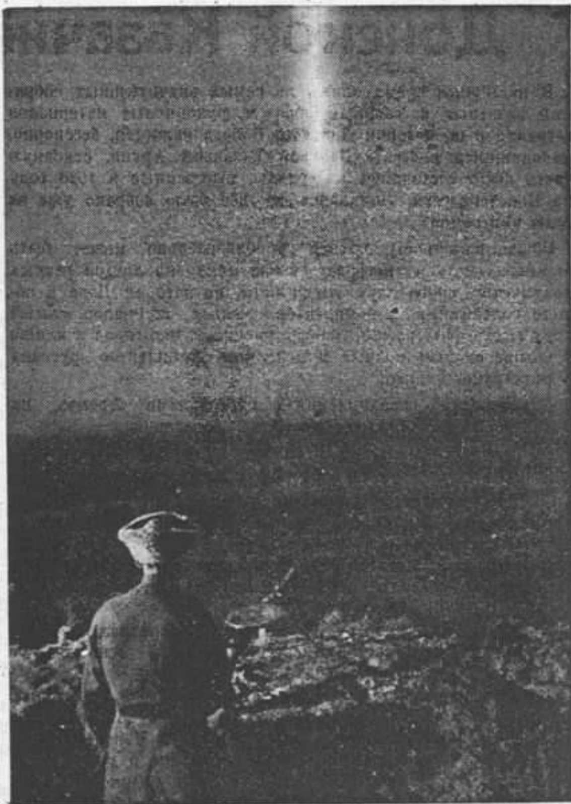
На охране железнодорожного пути от партизан