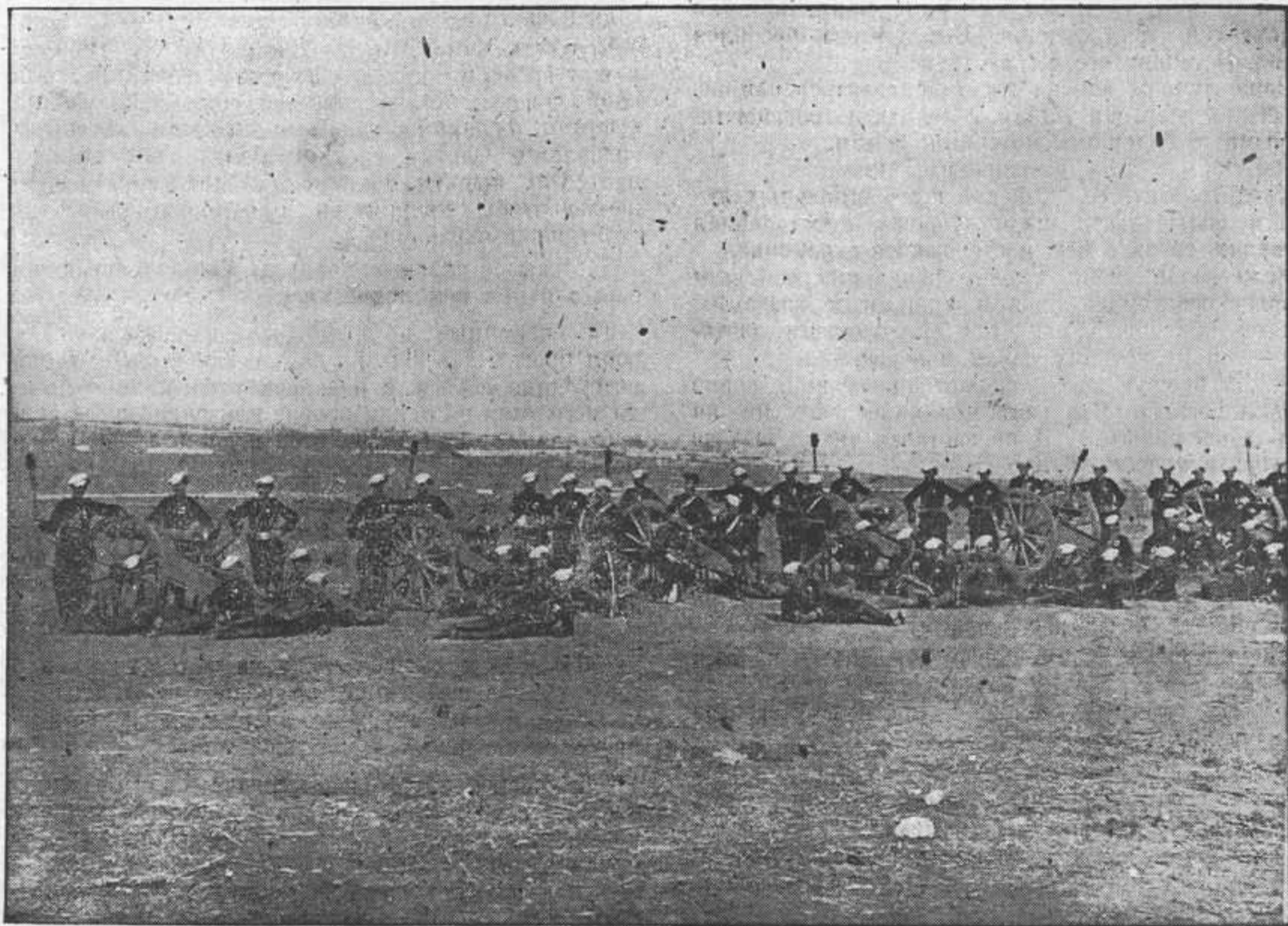
Шестая лейб-гвардии Донская казачья Е. И. В. Наследника Цесаревича батарея на передовой боевой позиции, с 12 февраля по 25 августа 1878 года, у Чифлика Ай Мама