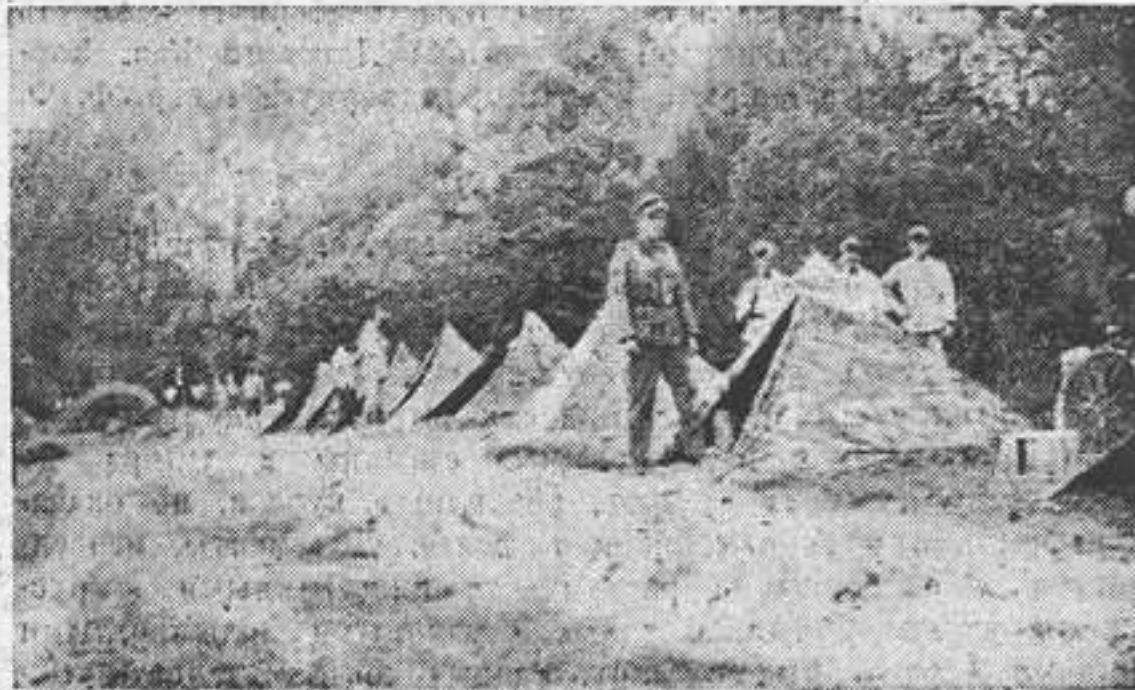
Юные казаки в лагере

— Ничего ты не знаешь, может, ты и не донской, а кубанец, — Худиков на каждом слове ловил Донца Володю. Донец после всех приехал в школу, и Худиков в нем увидел соперника в верховой езде. У Донца не было прикре-