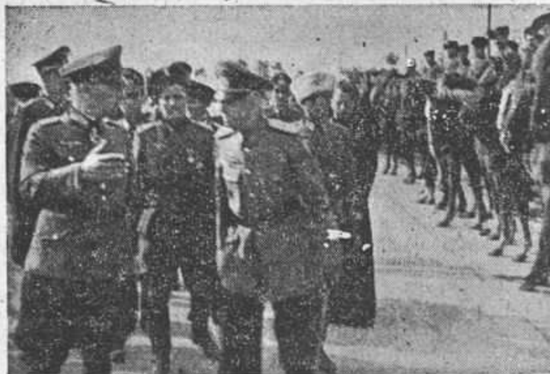
На полковом смотре

Отец — храбрец, удалой человек, бесшабашная натура. Имел все степени Георгия — кресты и медали. Доходил до чина сотника. Из-за бесконечных приключений несколько раз разжаловывался и умер вахмистром. С такими людьми Степан Разин гулял по Волге, «Москвой тряс»; Ермак Тимофе-