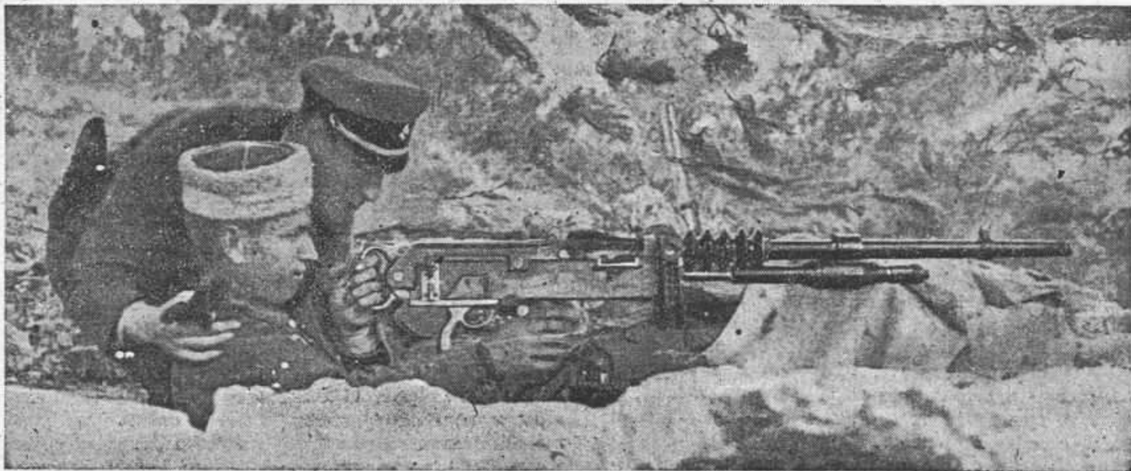
Учебная стрельба из автомата