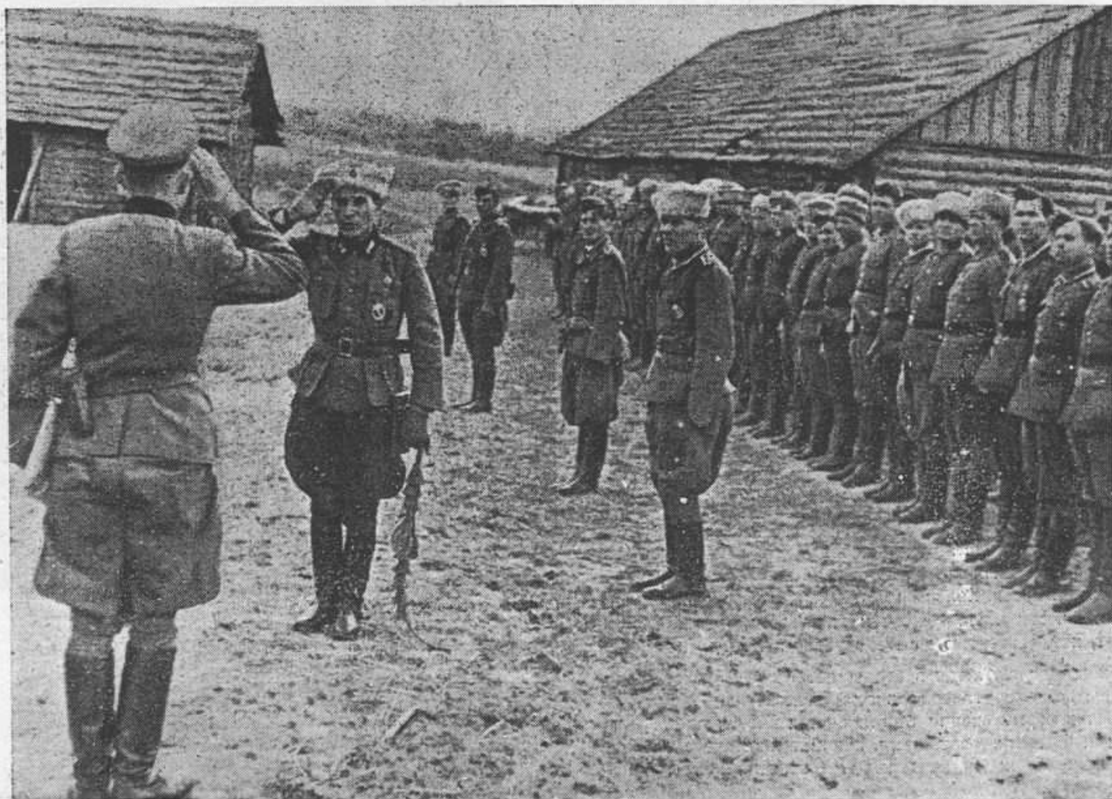
На утренней позерке