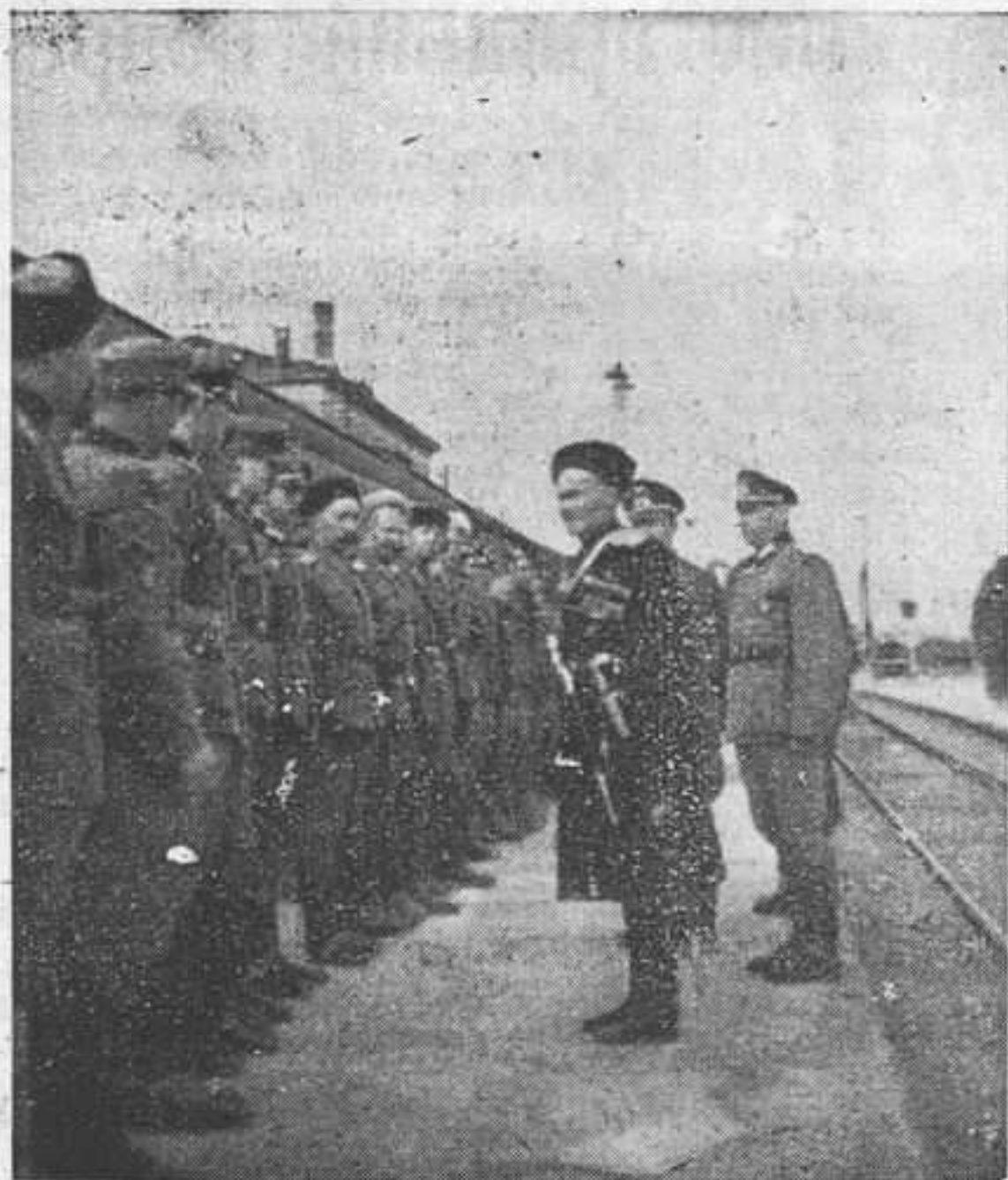
Начальник казачьего резерва ген. А. Г. Шкуро посетил Н-ой пеший казачий батальон