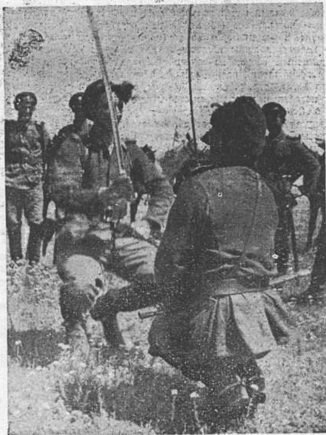
Делу — время, но и потехе — часок