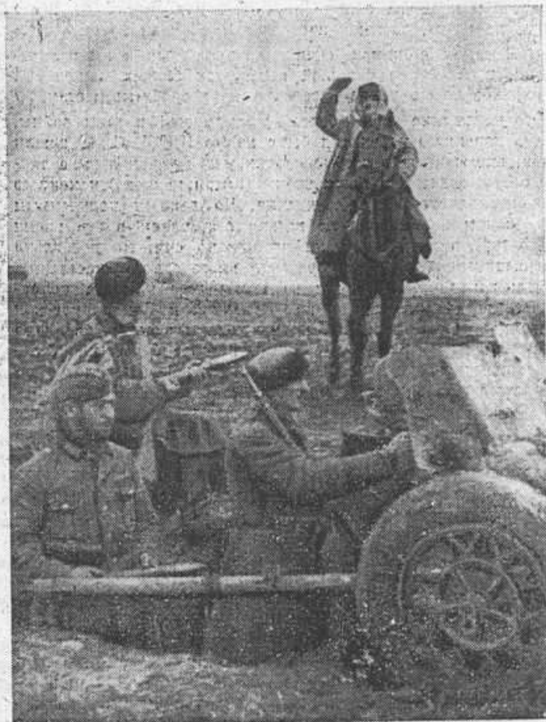
Во время боя конный связист прискакал к артиллеристам с приказанием от начальства