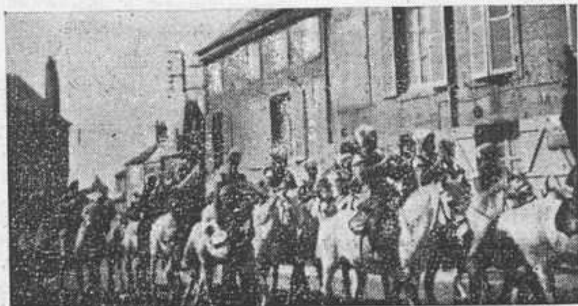
Прохождение Н-го казачьего полка через город Х. под звуки марша собственного полкового оркестра на белых конях