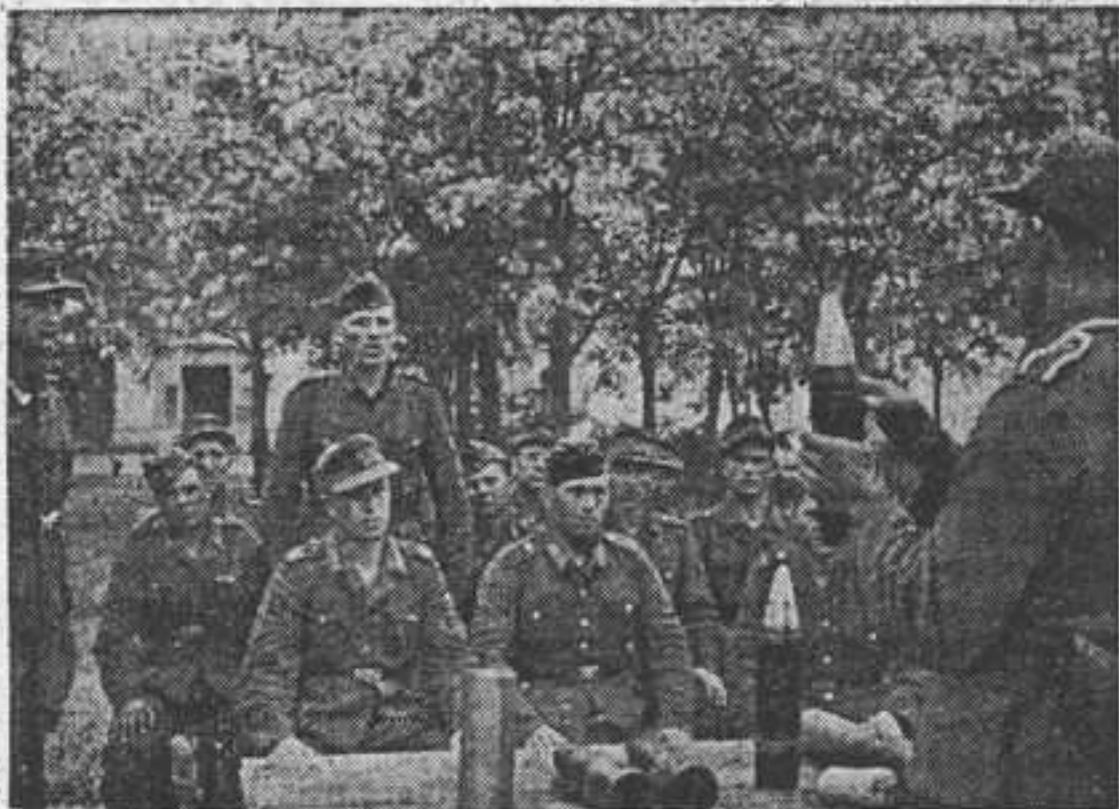
В учебной команде — урок артиллерии