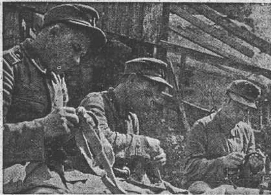
В шорной мастерской Н-го каз. полка

на другого, я пошел к казакам, а партизаны остались на заводе.