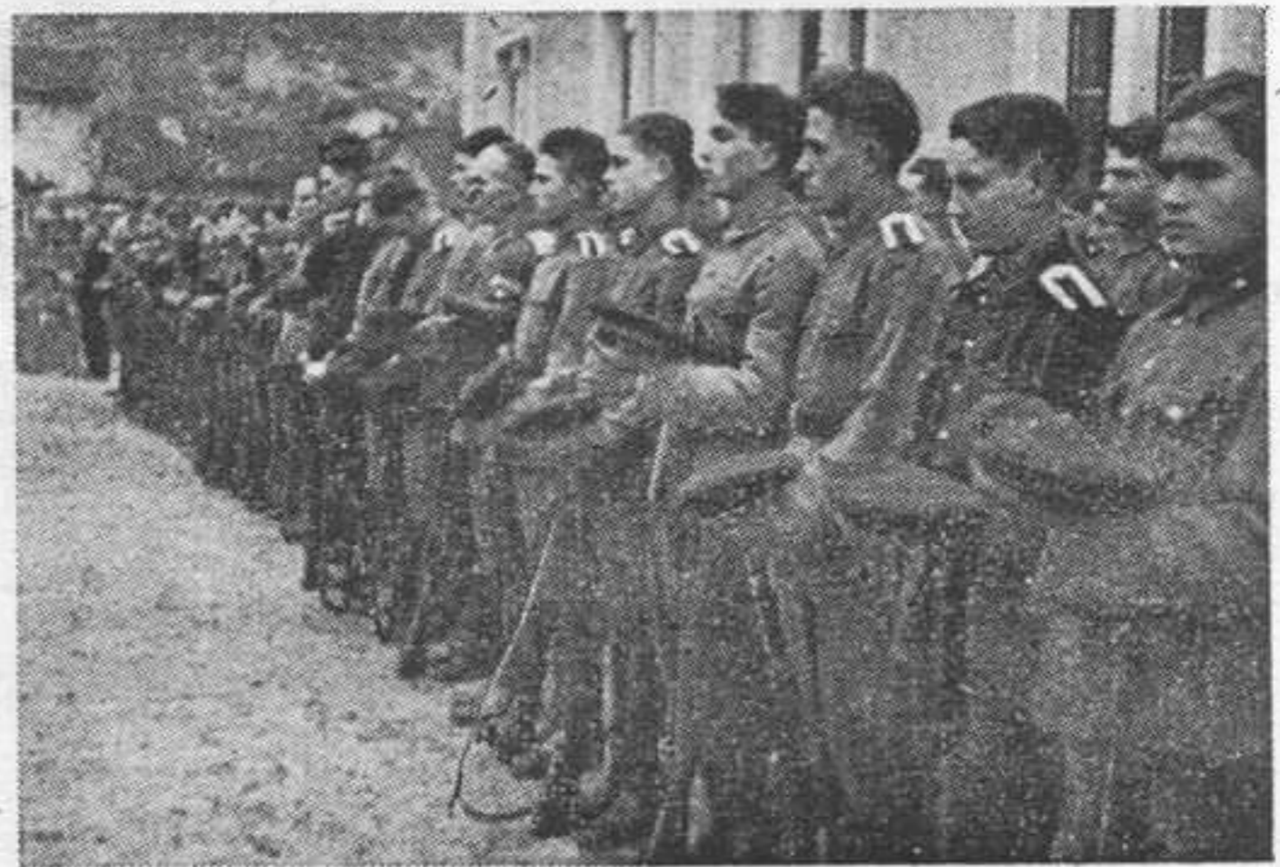
Юнкера на молебне

С напряженным вниманием радостно вслушивались молодые юнкера в благородные и мужественные слова Ка-