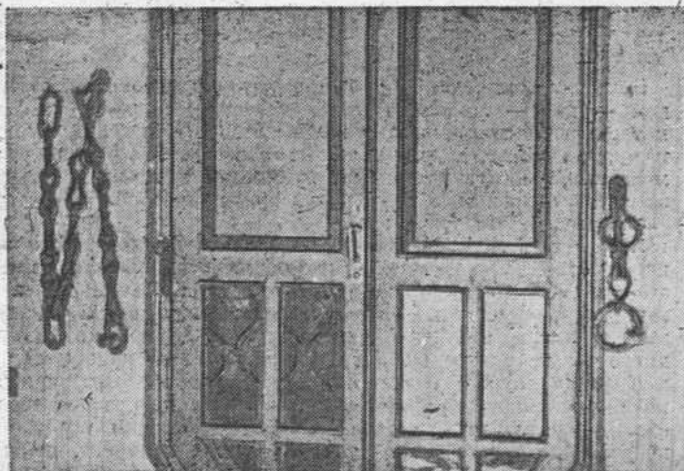
Цепи Степана Разина в Старочеркасском соборе.