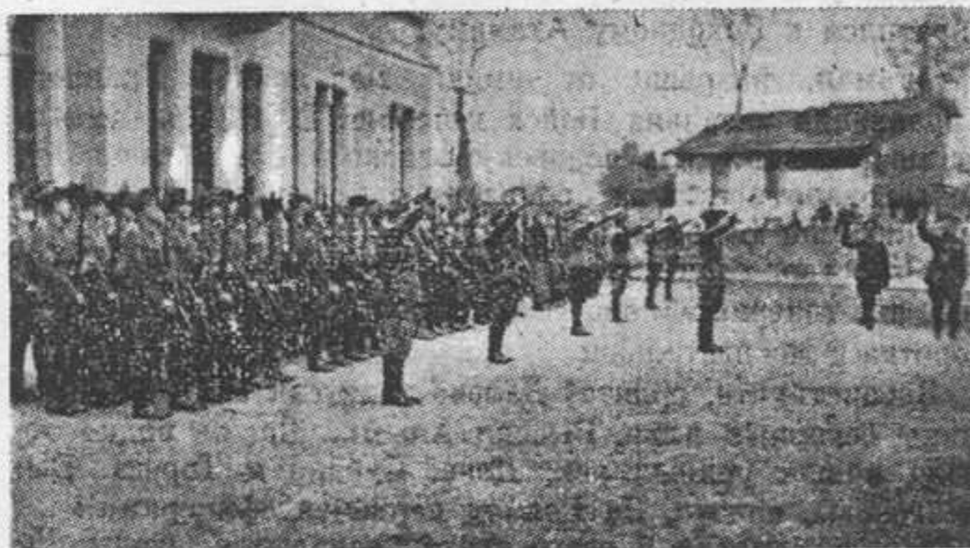
1-ое казачье юнкерское училище

«Господа офицеры и казаки! Вглядываясь в ваши шеренги, я узнаю много знакомых лиц. Я узнаю тех, кто