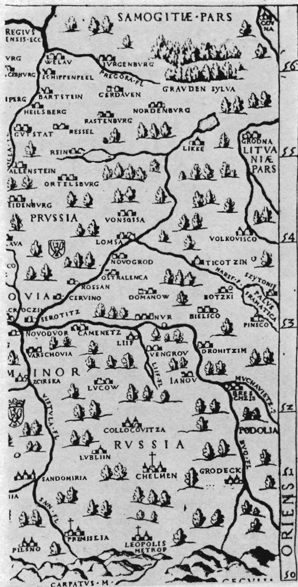
Рис. 2. Подлясье на карте Центральной Европы Г. Лиля и М. Трамезино (Рим, 1553)

небольшими компиляциями и переводами. Не исключено, что его же рукой переписано и известное предисловие В. Тяпинского к Евангелию [8].