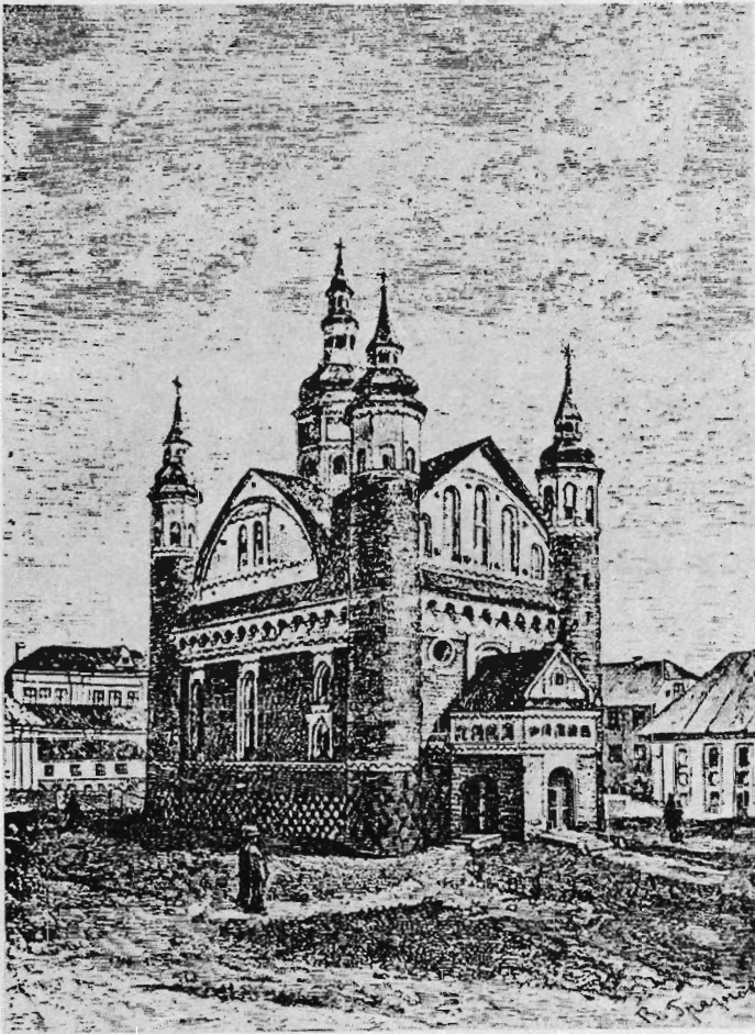
Рис. 1. Вид Супрасльского Благовещенского монастыря (Гравюра XIX в.)

мог получить только из расположенного рядом Супрасля. В XVI в. Супрасль был одним из главнейших хранилищ книжных богатств не только в Великом княжестве Литовском, но и на всем востоке Европы, в котором сберегалось большое число памятников мировой культуры, среди них — знаменитый Супрасльский кодекс XI в. — гордость всего славянского мира. Именно в то время в Супрасльском монастыре были написаны многочисленные оригинальные литературные сочинения, делались переводы с различных языков, интенсивно работала книгописная мастерская. Супрасльские книжники владели не только церковно-славянским языком, но также латинским и греческим, не говоря уже о тогдашнем литературном «русском» и «простой молве», на которой особенно охотно сочинялись различные возбличения и вообще полемические произведения. Супрасль нужно рассматривать и как один из центров славянского стихотворства — традиционной гимнографии и виршеписания [7. С. 180—181].