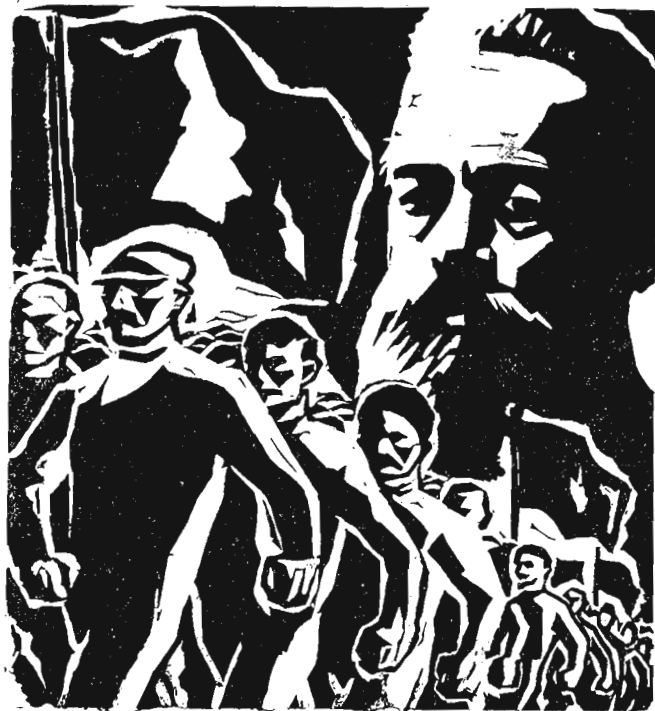
Рис. 3. А. Жендов. Вождь. 1931 г.