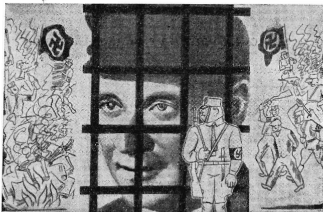
Рис. 2. А. Жендов. Европейский пролетариат против фашизма. 1933 г.

материален и убедителен. Боковые части композиции — тонкий, выразительный рисунок пером.