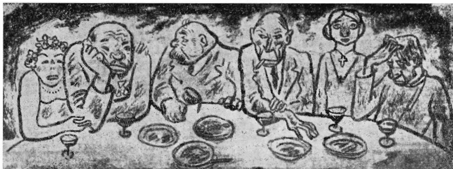
Рис. 1. А. Жендов. Те, кто уже шестнадцать лет ожидает поезда в Москву. 1933 г.

Юность Жендова проходила в очень тяжелые годы — в сложных общественных условиях, наступивших после первой мировой войны. Огромную роль в формировании мировоззрения художника сыграли события, связанные с революционным подъемом в стране после 1917 г.