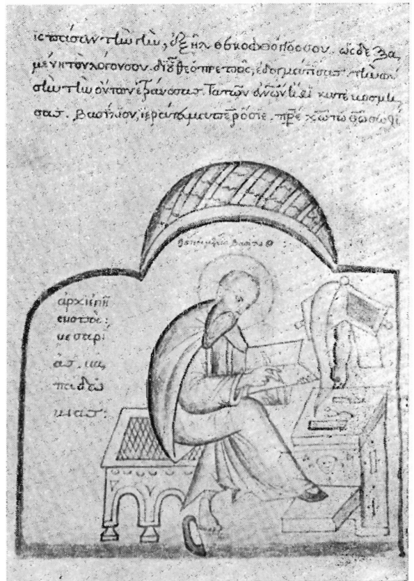
Рис. 2. Василий Великий. Миниатюра. Шестоднев Василия Великого