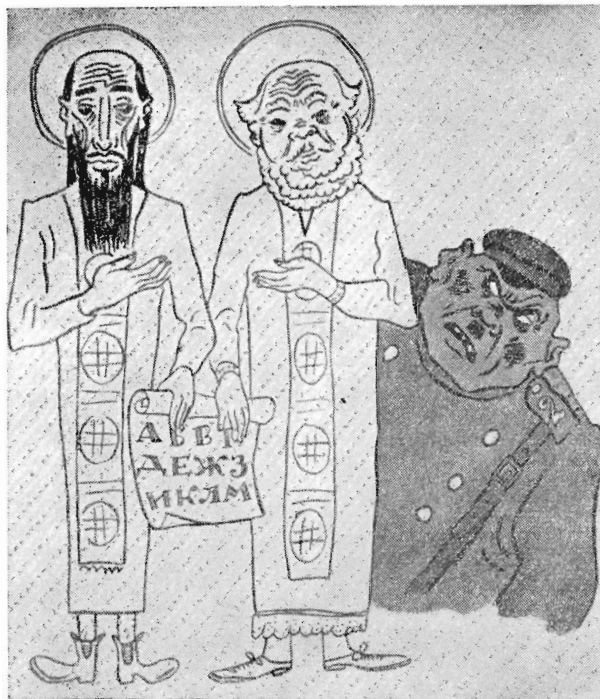
Рис. 4. А. Жендов. По- лицейский: А вы переда- ли свою азбуку в дирек- цию полиции на предва- рительную цензуру? 1933 г.