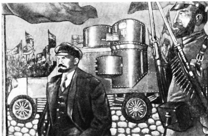
Б. Либерский. Ленин. Масло

в довоенные годы был связан с революционным движением и своим творчеством всегда стремился откликнуться на значительные жизненные явления. Поэтому его обращение к ленинской теме не было случайным.