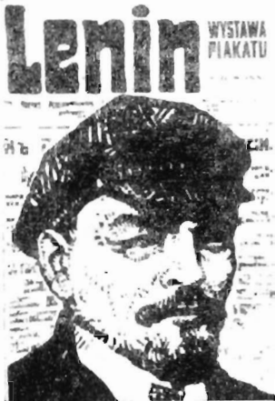
Ф. Старовейский. В. И. Ленин. Плакат

Чрезвычайно ценный и своеобразный вклад внесли в лениниану польские плака-