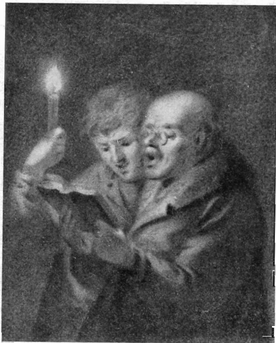
Рис. 2. В. Ванькович. Певчие римско-католического собора в Вильно. Гуашь. Национальный музей в Варшаве (Публикуется впервые)

Фактом, говорящим в пользу ранней датировки этой миниатюры, является жанровый характер сцены. Ванькович внимательно передает