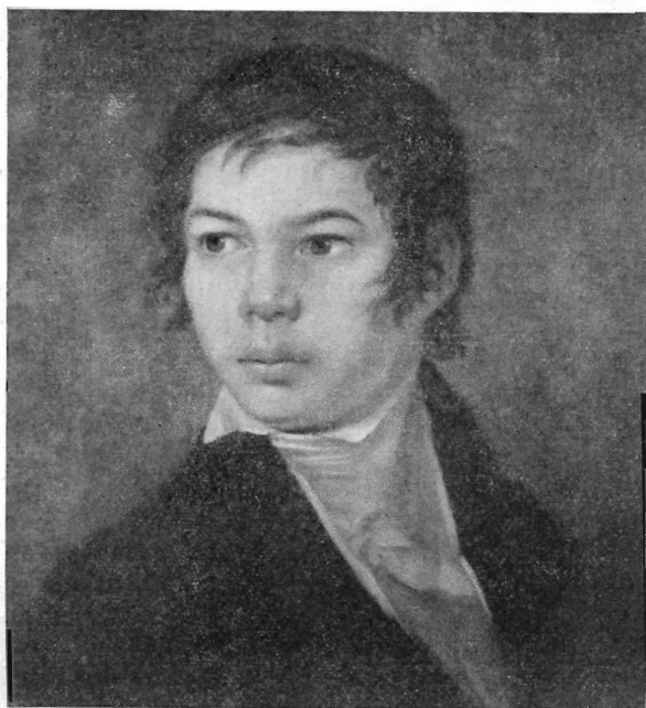
Рис. 4. В. Ванькович (?). Портрет Эдварда Ромера. Масло. Национальный музей в Варшаве (Публикуется впервые)

мого, его внутренней силе. Здесь романтизм действия, а не романтика чувства, как в рисованных портретах.