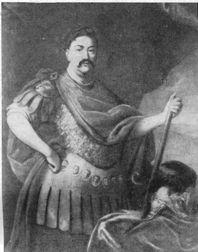
Рис. 1. Ежи Элеутор Шимонович-Семигировский (ок. 1660—1711). Портрет короля Яна Собеского в античных доспехах. Ок. 1693 г. Холст. Масло. Национальный музей в Варшаве

ризованное, в высшей степени индивидуализированное лицо. Доминировать может то одно, то другое начало (рис. 2,3).