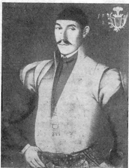
Рис. 5. Юзеф Фаворский. Портрет Яна Пендзицкого. 1790 г. Холст. Масло. Национальный музей в Познани