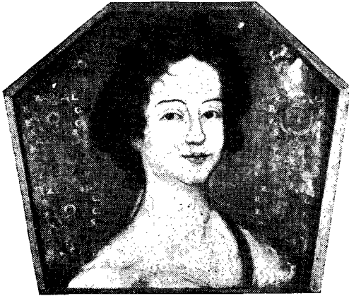
Рис. 4. Трудный портрет Зозфи Боской. XVII в. Масло на железе. Национальный музей в Варшаве

Нагробный портрет имел, таким образом, очень точное назначение: он должен был представить усопшего, скрытого в гробу (иногда похороны происходили через несколько месяцев после смерти; может быть, такой обычай и вызвал потребность еще раз напомнить его черты) « ad vivum ». Такой характер изображения, когда «как живой» изображался человек, заведомо мертвый, уже оплаканный близкими, исключал и слишком бытовую трактовку образа, и малейшее легкомыслие. Концентрированности внутреннего содержания соответствовало то, что живое лицо сочеталось с абстрактным, пустым фоном, точно залитым серебристым холодным светом (надгробные портреты всегда сохраняют этот цвет металла в своих фонах — они писались по олову, железу, редко по серебру), светом «ниоткуда», что рождало острое и странное впечатление, что умерший общается с близкими, глядя на них как бы из иного мира. Прикрепленный к изголовью гроба, портрет возвышался над толпой на высоком траурном катафалке, поставленном посреди церкви под сенью траурных знамен. Все вместе создавало своеобразную, мрачно-торжественную паратеатральную ситуацию, в которой изображение играло роль своего рода « memento mori ». Подобная многозначность искусства очень характерна для барокко.