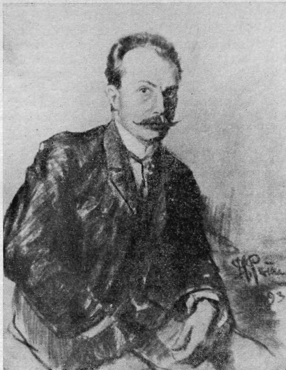
И. Е. Репин. Портрет Густава Франка (пастель, 1893).

(1866—1916) написал Проусеку письмо, где были слова: «Мы хотим расширить рубрику о зарубежном искусстве. Не были бы Вы так любезны, не написали ли бы краткий реферат о России» [11, с. 33]. В мартовском номере того же года Проусек поместил информацию об изданной Экспедицией книге о Репине. Проусек посылал Франку номера журнала «Вольные смеры», а тот показывал их Репину. В письме от 2/14 июня 1899 г. Франк сообщил Проусеку, что в этот день у него был Репин и что они беседовали о «Вольных смерах». Во время этой беседы Репин изъявил согласие дать какую-нибудь из своих работ для репродукции в чешском журнале. «Что ты об этом думаешь?», — писал Франк [7].