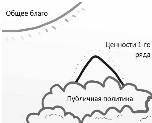
Рис. 3. Аксиологическая модель национального государства — общий случай

(обычно, имея целью повысить собственную легитимность; впрочем, и ответ на вопросы расширения собственной ресурсной базы тоже мог быть причиной такой политики). Подобное обязательство суверена фактически равносильно его самоограничению в некоторых вопросах проявления своей воли, а следовательно и своей власти, с одной стороны, и положению для себя целей, связанных с общественным развитием, — с другой. Последнее вмененно вводит в дискурс вопросы эффективности, а значит, способствует меритократии и появлению соответствующих социальных лифтов для обеспечения возникающего комплекса проблем адекватными человеческими ресурсами.