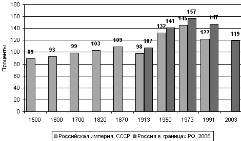
Рис. 1. ВВП на душу населения России в % к среднемировому в 1500–2005 гг. Источники: 1500–1998 гг. — Agnus Maddison, The World Economy. Historical Statistics . OECD, 2003; ООН, МВФ, ОЭСР, ФСС

на основе оплаты «входного билета» или выплаты регулярной ренты. Обобщенная «агора» как место формирования публичного интереса приватизируется государственной бюрократией: «В России нет борьбы партий, но есть борьба учреждений» 24 . Ибо — «дома сидеть надо!» 25 .