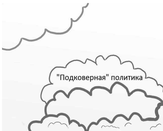
Рис. 4. Аксиологическая модель одного из вариантов государства с неопределенной моделью общего блага

феру стимулирования к делиберации для нахождения общеприемлемого компромисса, и гарантируют впоследствии данный компромисс.