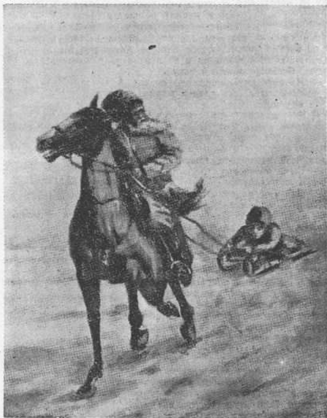
Святочное баловство внука